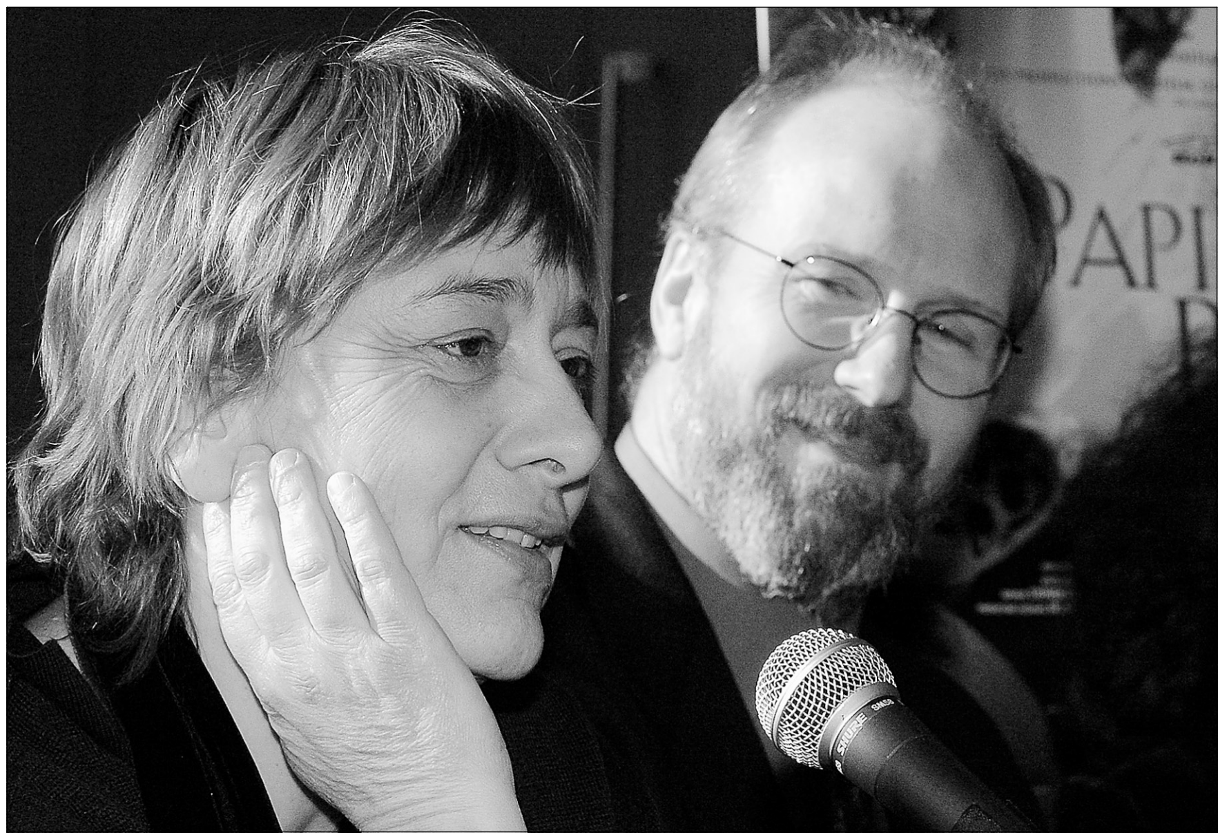
La réalisatrice Léa Pool et l'acteur William Hurt se sont entretenus avec les journalistes, hier à Montréal.