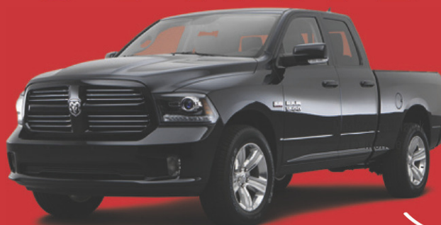
modèle sport montré

modèle 200 c montré À PARTIR DE, ACHAT AU COMPTANT CHRYSLER 200 LX 2015 19995$*