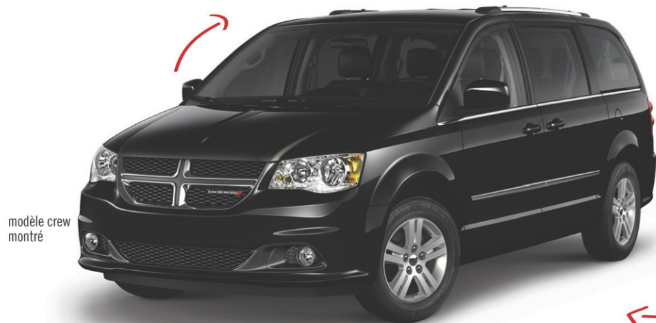
modèle crew montré

LE PLUS GROS CHOIX EN INVENTAIRE EN MAURICIE ET LA LIVRAISON EST RAPIDE!