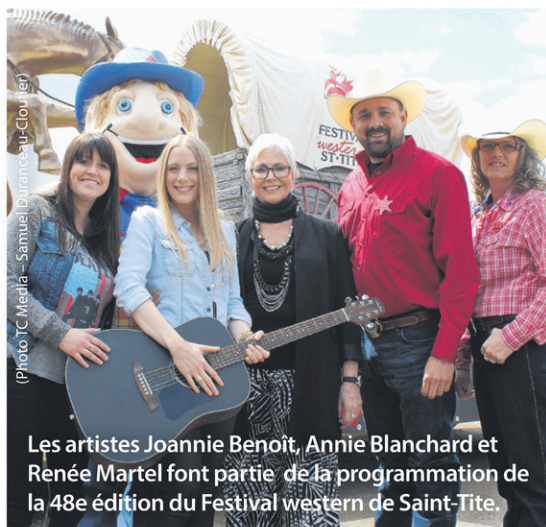
Les artistes Joannie Benoît, Annie Blanchard et Renée Martel font partie de la programmation de la 48 e édition du Festival western de Saint-Tite.