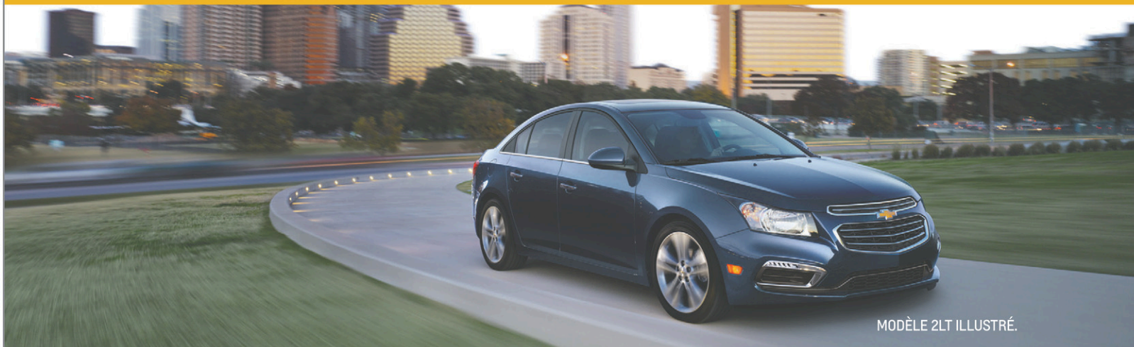
MODÈLE 2LT ILLUSTRÉ.

NOUS PAYONS VOTRE 1 ER MOIS DE LOCATION. 2