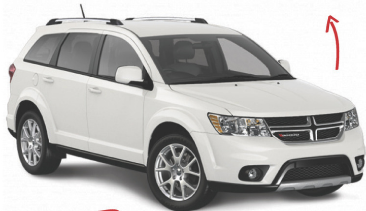
modèle R/T rally montré

À PARTIR DE, ACHAT AU COMPTANT DODGE GRAND CARAVAN SE 19995$* LE PRIX INCLUT 8100 $ DE REMISE AU COMPTANT. LES FRAIS DE TRANSPORT ET LES FRAIS SUR LE CLIMATISEUR.