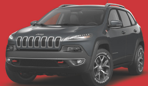
Modèle trailhawk 2015 montré

FINANCEMENT À L'ACHAT SUR NOS RAM ET JEEP SÉLECTIONNÉS EN INVENTAIRE