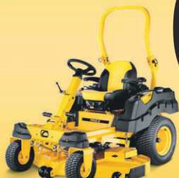
PRO Z 100

0% FINANCEMENT DISPONIBLE* SUR 12, 24 OU 36 MOIS*