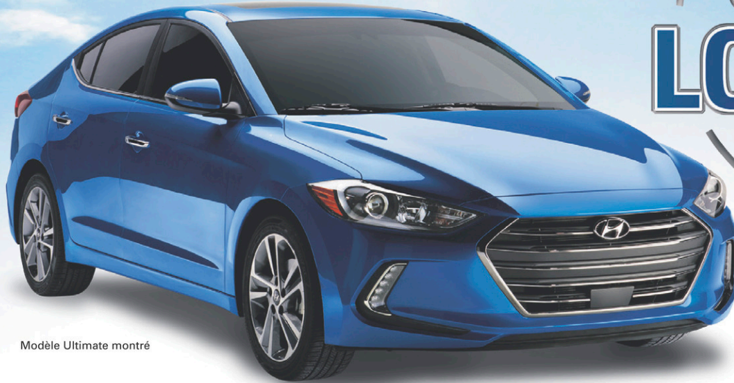
Modèle Ultimate montré