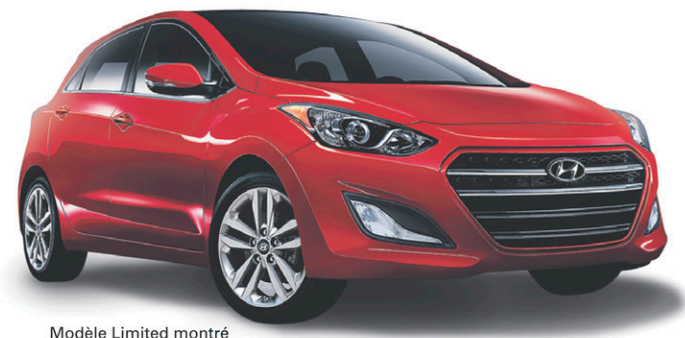
Modèle Limited montré