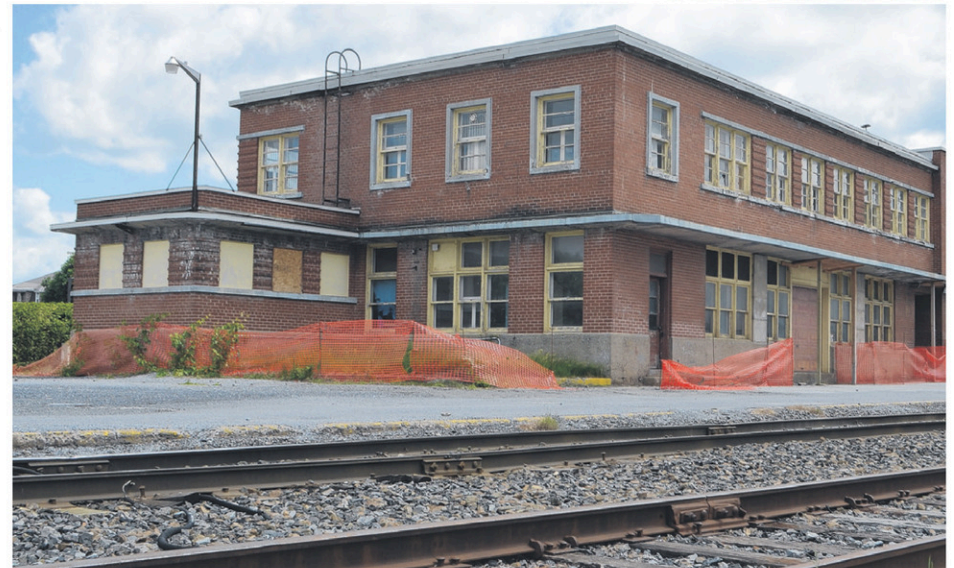
La gare de Farnham, un ancien joyau du Canadien Pacifique, se retrouve aujourd'hui dans un état de délabrement avancé.

Selon le Répertoire des lieux historiques du Canada , la construction de cette gare de style «International» – un mouvement architectural à la mode au milieu du siècle dernier – «témoignait du désir de l'entreprise d'augmenter sa visibilité et de véhiculer une image axée sur l'avenir». Il faut préciser que les activités du CP étaient alors à leur apogée et que «Farnham était devenue le centre administratif du réseau