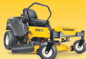
RZT L / RZT S

*SELON LES TERMES ET MODALITÉS DÉFINIS. CONSULTEZ VOTRE CONCESSIONNAIRE INDÉPENDANT CUB CADET POUR PLUS D'INFORMATIONS.