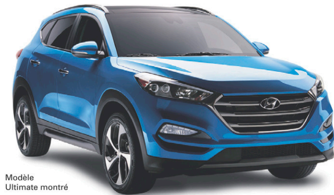
Modèle Ultimate montré