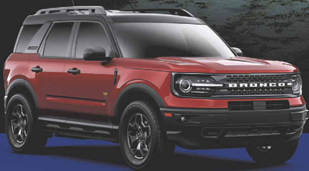
BRONCO SPORT 2021