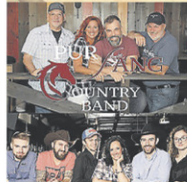
PUR SANG ET DELUXE RODÉO