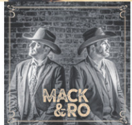
MACK & RO