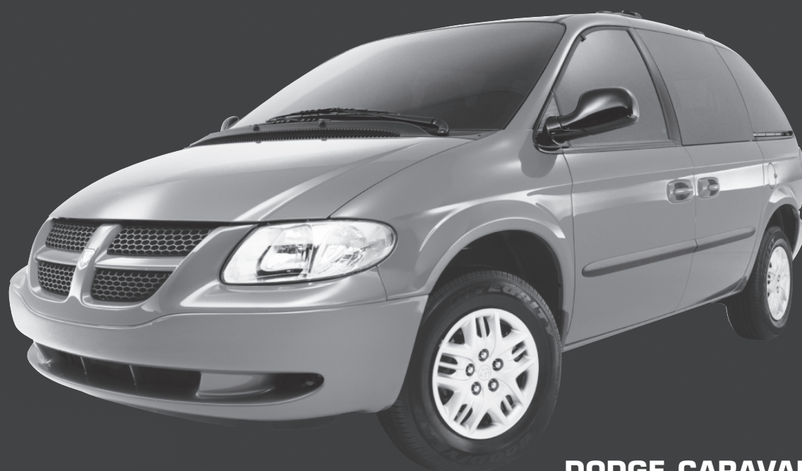
DODGE CARAVAN SXT