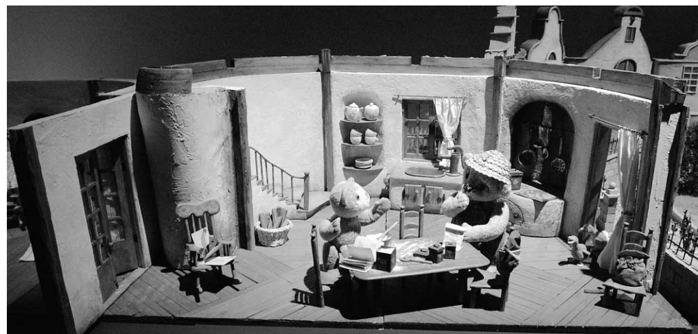
Une autre scène mettant en vedette Ludovic.

L'exposition Co Hoedeman — Les jardins de l'enfance se poursuit jusqu'au 30 novembre, à la Cinémathèque québécoise, 335, boulevard de Maisonneuve Est. Entrée libre. Informations : (514) 842-9768.