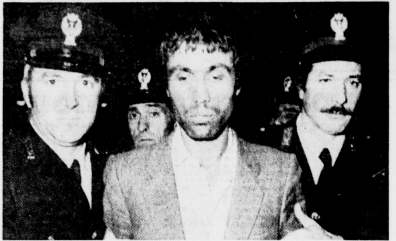
Accusé de tentative d'assassinat. Encadré de policiers romains, le terroriste turc Ali Agca est conduit vers les quartiers généraux de la police après avoir été formellement accusé, hier, de tentative d'assassinat contre la personne de Jean-Paul II.