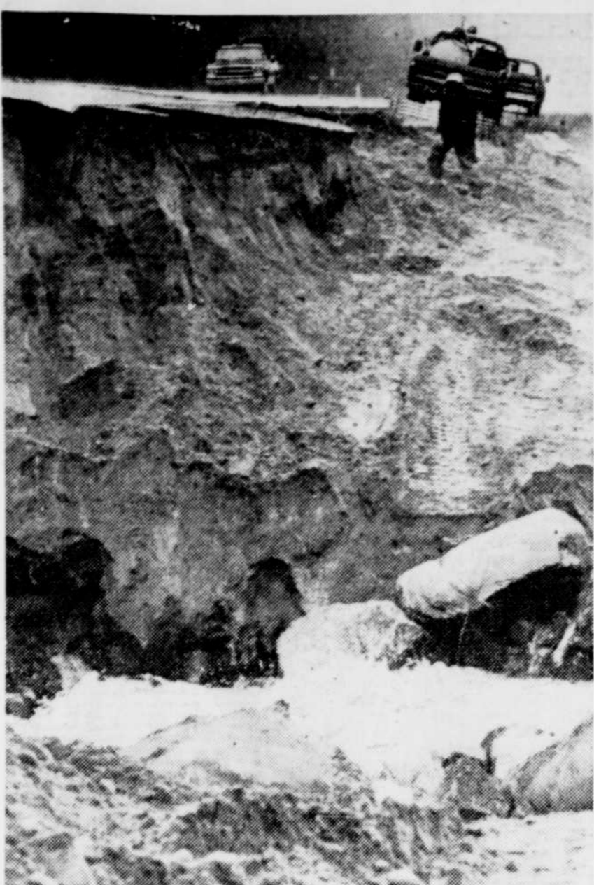
La pluie et les crues du dégel printanier ont miné la chaussée sur une distance de 30 à 40 pieds.