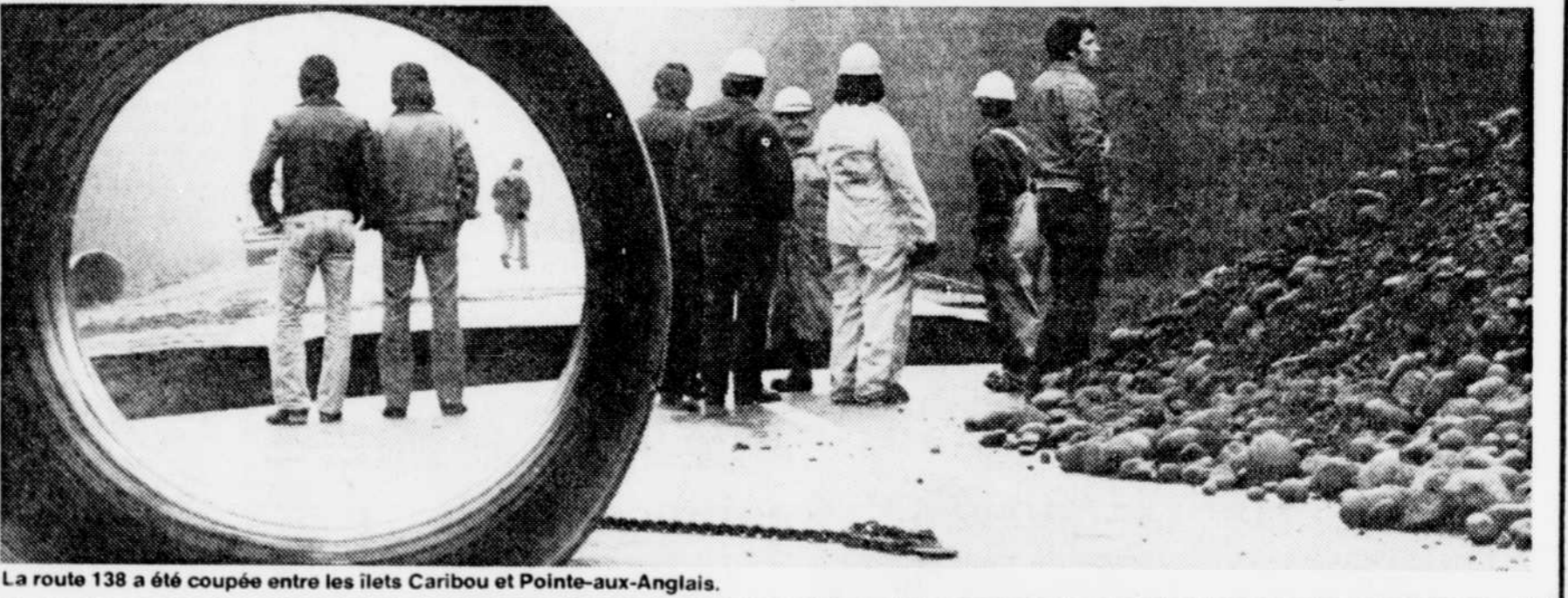
La route 138 a été coupée entre les îlets Caribou et Pointe-aux-Anglais.