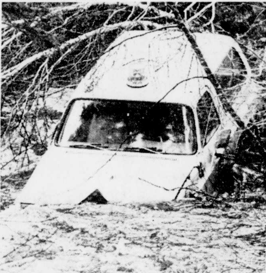
C'est finalement dans cette position que s'est retrouvée le 4X4 des employés de Québec-Téléphone.