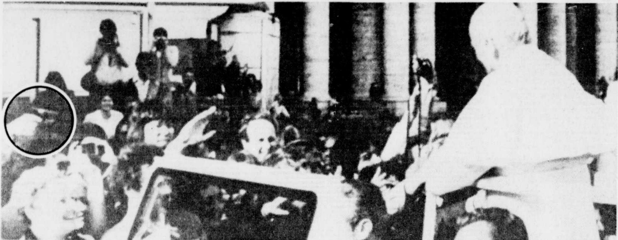
L'arme de l'assaillant pointée vers le pape A l'extrême gauche de la photo (en médaillon) la main de l'assaillant braquant son arme vers le pape alors qu'il salue la foule réunie place Saint-Pierre. Un instant plus tard, Jean-Paul II était atteint de trois balles. Cette image a été tirée d'un film 8mm réalisé par une personne non identifiée et obtenue par l'Agence italienne de nouvelles ADN Kronos.