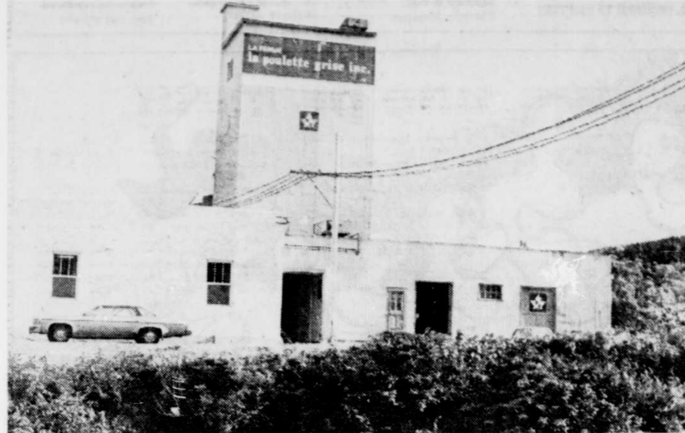
Les bâtiments de "La poulette grise".