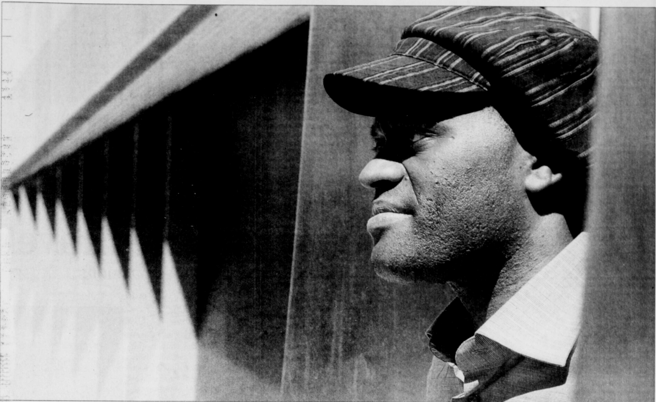
Alain Mabanckou a 40 ans, est né au Congo-Brazzaville, a passé une quinzaine d'années en France et vit aux États-Unis depuis quatre ans. Auteur de cinq romans et de six recueils de poésie, il conçoit l'écriture ainsi. « Je voudrais que le chant que j'entonne dans mes livres soit ouvert à toutes les sensibilités. »