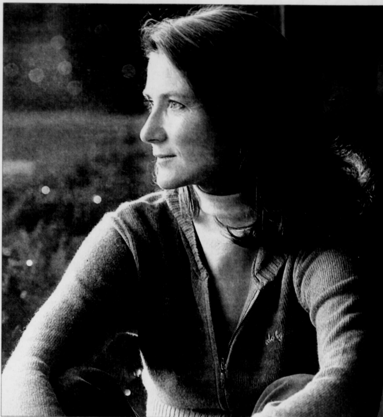
La tragédie du 11 septembre a poussé Ève de Castro à laisser de côté le roman historique pour un thriller contemporain.

R Ce n'est pas ce qui a prévalu. J'ai une gourmandise de vivre trop grande pour cela. L'anxiété se situe plus dans mon travail que dans le mouvement de la vie. Non, j'ai eu un mouvement de révolte existentielle très profond en voyant ce que le monde était en train de devenir. Ce en quoi je croyais, ce pourquoi j'avais envie de vivre était soudainement mis dans une perspec-