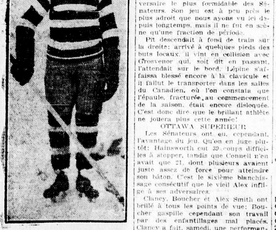
KING CLANCY, sensationnel capitaine d'Ottawa, qui fut l'étoile de la partie de samedi avec le Canadien à l'Auditorium.

DES GARS FATIGANTS A vrai dire, ils sont loin d'être commodes ces gladiateurs de la Métropole.