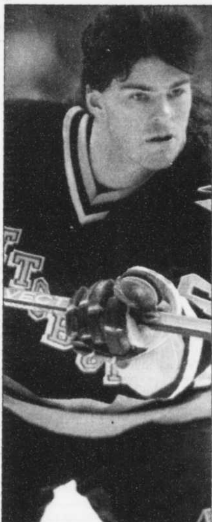
On parle souvent de Lemieux, mais Jagr ne sera pas facile à rejoindre.

Francis est surpris uniquement de sa production en attaque, pas de celles de Lemieux et Jagr. « Assurément que le nom le plus surprenant des trois est le mien, a-t-il avancé. On s'attend à ce que Mario et Jaromir soient en tête. J'ai profité de jouer avec eux pour me faufiler au troisième rang. »