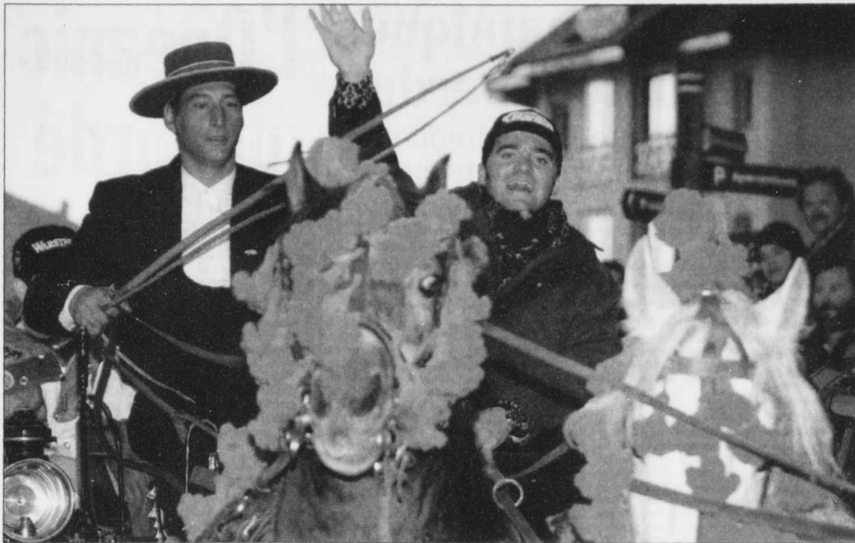
Alberto « La Bomba » a eu droit à la grande parade, hier, saluant ses chauds partisans qui guettaient cette performance de leur héros depuis fort longtemps.

Le joueur de tennis suédois Mats Wilander, dans sa première entrevue depuis qu'on a révélé qu'il s'est adonné à la cocaïne aux Internationaux de France l'an passé, soutient qu'il « n'a jamais fait usage de drogues illégales ». « J'espère que les gens me croient », a-t-il dit, hier, lors d'une conférence de presse couverte en majorité par des journalistes suédois. (AFP)