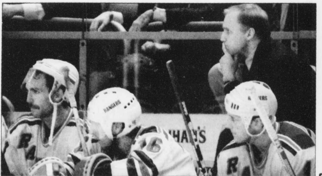
La dernière minute du match de jeudi contre les Islanders a été très longue pour les Rangers de New York qui voyaient s'enlever l'occasion d'inscrire une nouvelle marque d'équipe à domicile.

« Ce n'était pas une source de distraction pour nous, a affirmé Messier.