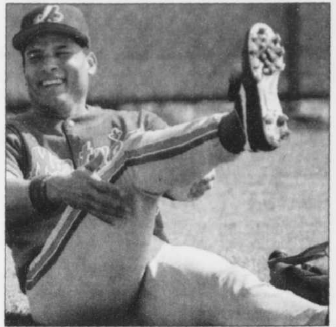
Pour une fois qu'un joueur est heureux avec les Expos...

« L'an passé, je n'étais pas protégé mais je sais maintenant à quoi m'attendre. J'ai l'intention d'être plus patient. »