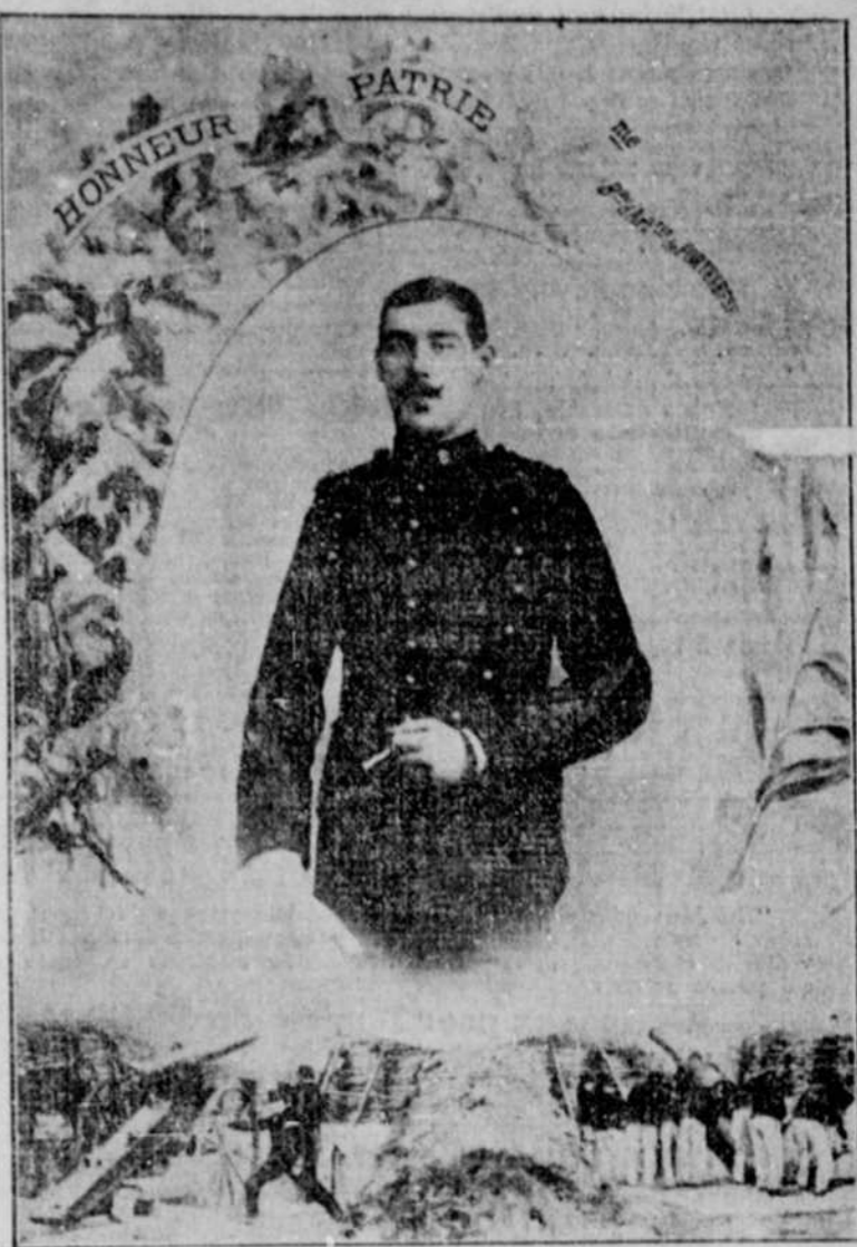
Le Brigadier Baron du 8e Bataillon d'Artillerie de forteresse, à Epinal, (Vosges) l'un des plus beaux soldats de l'armée française.