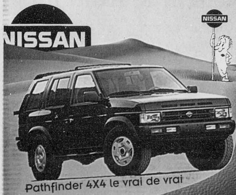
Pathfinder 4x4 le vrai de vrai

Informez-vous de notre service V.I.P. auprès de nos représentants.