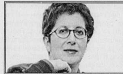
L I S E B I S S O N N E T T E

L'appel téléphonique avait été incertain. J'ai ouvert Le Journal de Montréal au cas où j'y trouverais une trace de l'accident qui était peut-être arrivé. Elles étaient côte à côte en page trois, la photo du camion de voirie et la photo de la petite voiture noire emboutie. Un cliché, une vie. Je me répétais un nom, pourtant absent de la légende: Pierre Ayot tué sur la route 158 qui était la sienne, entre Le Lac Noir et Montréal. Comme tous ses amis, en cette minute et les suivantes qui ne passaient plus, je n'ai pensé qu'au mal de Madeleine, car on ne les sépare pas. Puis Pierre est revenu, car on n'éteint pas sa force. Toute la journée, le téléphone a sonné, nous avons parlé de lui. Je n'écris pas, ici, un hommage à un mort.