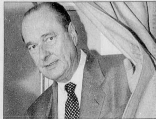
Jacques Chirac dans l'isolement.