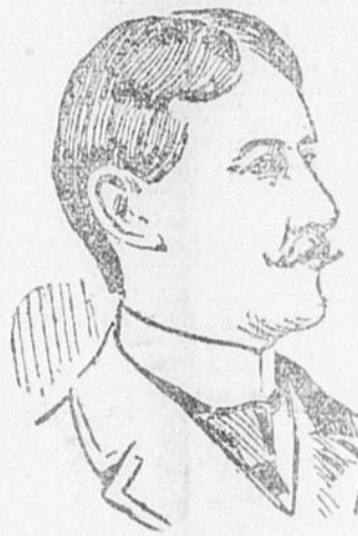
LE COLONEL PILCHER Qui s'est avancé de dix milles dans l'Etat Libre d'Orange, à la tête d'un contingent de 400 Canadiens et Queenslanders.

La belle-mère de Lanfume souffre d'un asthme. Elle a fait venir un médecin qui la rassure en lui disant: "Un asthme est un brevet de longue vie. — Guérissez-la vite, dit Lanfume en reconduisant le médecin.