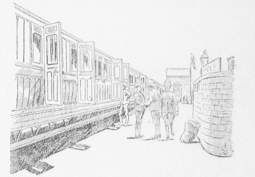
Le voyage de Cape Town à De Aar. Dessin d'une photographie prise pendant que les soldats du premier contingent canadien étaient à prendre leur dîner.