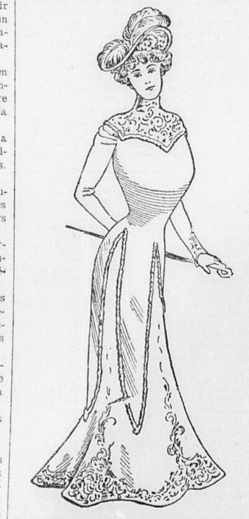
Robe princesse en velours noir, avec broderies en jais et paillettes.

Extrait du discours de M. Laurier tel que publié par "La Patrie": L'orateur parle de la politique douanière et de la préférence de 25 p. c. accordée aux produits anglais. Il explique comment, grâce à cette politique, le Canada a obtenu la dénonciation des traités de commerce belge et allemand, par l'Angleterre, dénonciation que les conservateurs avaient demandée en vain. M. Laurier n'aurait-il pas mieux fait d'expliquer pourquoi il a refusé d'avance toute préférence que l'Angleterre pouvait lui offrir? Il n'y a donc pas moyen de forcer le premier ministre à se défendre.