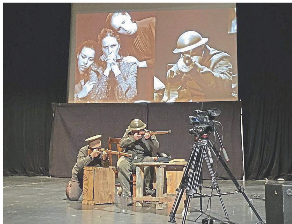
Ce spectacle allie numérique, théâtre, musique et danse.

Le Domaine Trinity est situé au 360, rue McGinnis, à l'angle de la 11 e Avenue, dans le Vieux-Iberville.