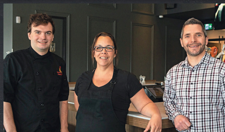
Notre équipe dévouée vous attends !

Réservez votre place pour le Temps des Fêtes !