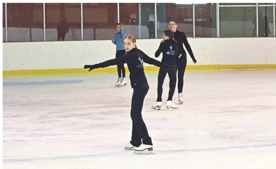
Plusieurs membres du Club de patinage artistique de Saint-Jean-sur-Richelieu participeront à l'Invitation Michel-Leblanc.

D'autres patineurs de la catégorie STAR entameront la journée de dimanche compter de 8h30 et la termineront autour de 15 heures.