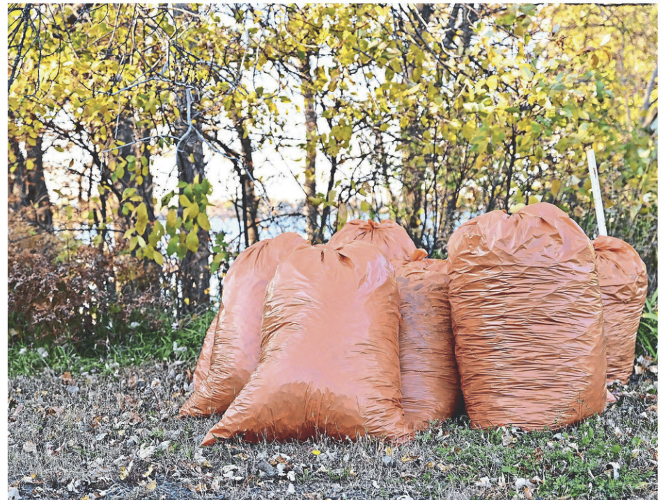
Le jour de la collecte de feuilles mortes, les citoyens sont invités à déposer leurs sacs en bordure de rue avant 7 heures.

Pour obtenir davantage de renseignements sur la collecte de feuilles mortes ou pour connaître l'horaire des écocentres, il suffit de consulter le site Web compo.qc.ca.