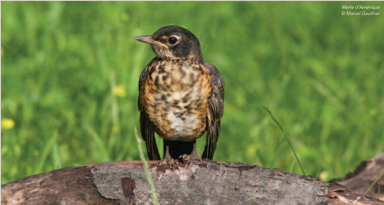
Merle d'Amérique

Réalisations. Le comité a entre autres fait un suivi des recommandations du cabinet Sassi comptable qui a effectué l'audit de l'exercice financier se terminant le 31 mars 2015. Le mandat de ce dernier a d'ailleurs été reconduit pour une autre année lors de l'assemblée générale de septembre 2015.