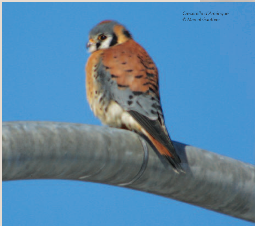
Crécerelle d'Amérique

en 2014-2015 a été améliorée et inclut maintenant des informations sur 130 chicots de grosse dimension et 17 placettes d'échantillons pouvant contenir plusieurs chicots.