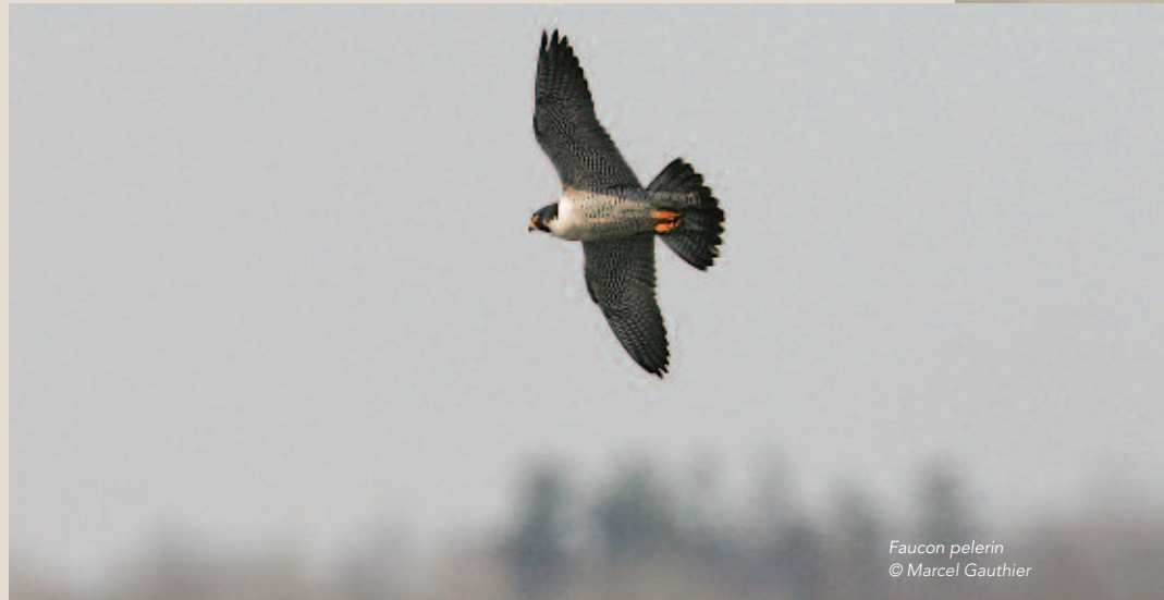
Faucon pèlerin

Objectifs. Mettre à jour les cartes de répartition des oiseaux qui nichent dans le sud du Québec et les comparer avec celles du 1 er atlas pour mesurer les changements survenus, dresser des cartes qui indiquent l'abondance relative des espèces dans le Québec méridional et établir une base de comparaison pour l'avenir, localiser des sites de nidification d'espèces spéciales (espèces en péril, espèces rares et espèces coloniales). Ces objectifs seront réalisés grâce aux données récoltées entre 2010 et 2014 au sud de la latitude 50°30' N. Le but ultime du projet est de produire une publication et une base de données sur les oiseaux nicheurs du Québec méridional qui serviront à des fins de conservation, de suivi et de recherche. Finalement, parallèlement à la préparation de la publication, des travaux de terrain dans le nord du Québec se poursuivront durant quelques années afin de documenter l'avifaune nicheuse dans un territoire très peu exploré à des fins ornithologiques.