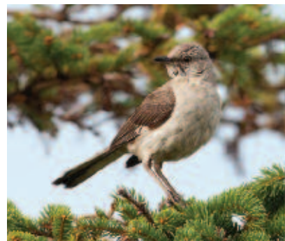
Moqueur polyglotte