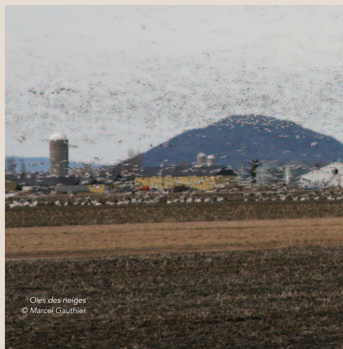
Oies des neiges

Réalisations 2015-2016. Les coordonnées des propriétaires des sites retenus ont été recherchées puis colligées dans une base de données. Au total, 115 propriétaires ont été identifiés dans quatre régions administratives (Capitale-Nationale, Chaudière-Appalaches, Estrie, Montérégie). De plus, un questionnaire a été développé afin de récolter des informations auprès des propriétaires sur leurs habitudes, l'utilisation de leur terrain et leurs plans futurs. Un rapport présentent les renseignements obtenus, les cartes, le questionnaire ainsi que des recommandations.