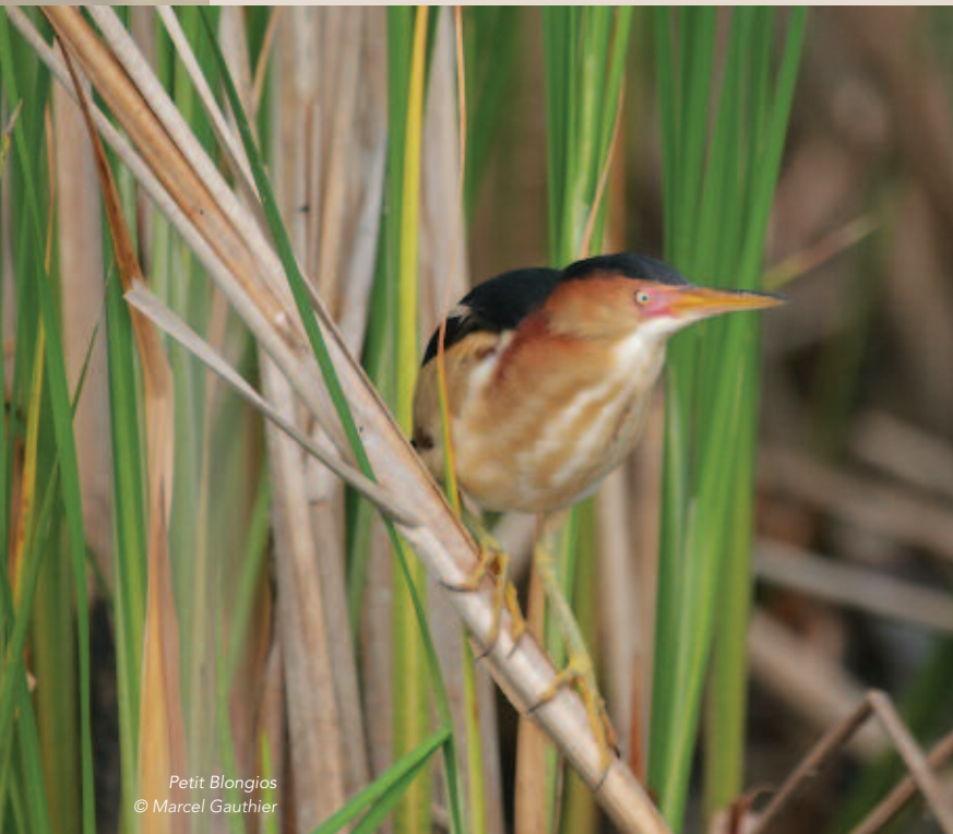
Petit Blongios

Réalisations 2015-2016. Des sondages téléphoniques auprès d'entreprises de ramonage de la Communauté métropolitaine de Montréal ont été effectués. Parmi les neuf compagnies sondées, sept ont accepté de reporter à l'automne leurs travaux de ramonage aux sites utilisés par le martinet afin de permettre aux oiseaux de compléter leur nidification. Par ailleurs, des démarches ont été entreprises auprès de six municipalités où des sites de nidification de Martinet ramoneur ont été observés selon la base de données SOS-POP et dont au moins un élément de la réglementation en lien avec le ramonage et l'entretien des cheminées rejoint un objectif de sensibilisation (ramoneur municipal, période de ramonage contraignante, obligation d'accessoire contraignant ou condamnation de cheminée non utilisée). Les municipalités de Beauharnois et de Mascouche ont ainsi accepté d'adapter leurs réglementations afin de considérer la présence du martinet sur leur territoire. Les municipalités de La Tuque et de Rimouski ont ajouté des clauses à leur demande d'offre de service pour le ramonage des cheminées. Les municipalités de Lac-Drolet et de Mascouche ont accepté de diffuser de l'information à leurs citoyens.