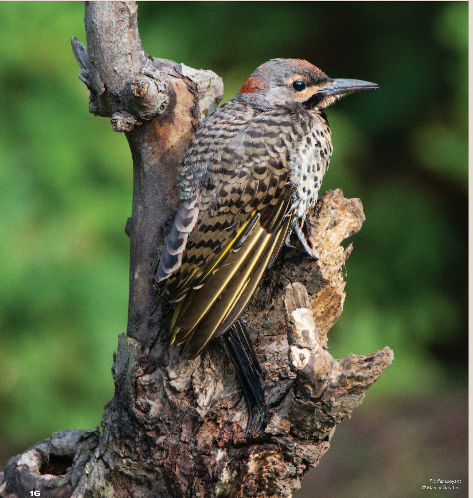
Pic flamboyant © Marcel Gauthier