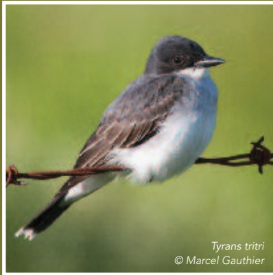
Tyrans tritri