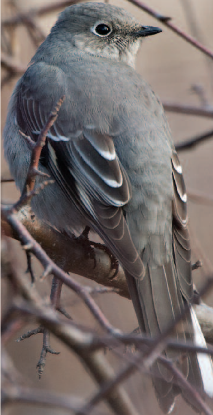
Solitaire de Townsend