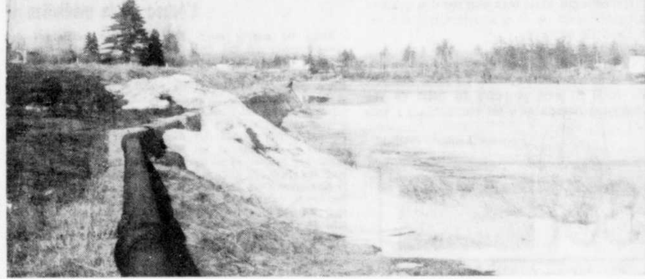
LES DANGERS D'INONDATION semblent écartés cette année, à Drummondville, à moins, bien entendu, que ne survienne une très grosse pluie de plusieurs jours. En effet, la glace a commencé à caler d'elle-même le long des rives de la St-François, et il semble que, dans son état granuleux actuel, elle ne sera pas un grand danger dans le cas d'une débacle éventuelle. Cette photo nous montre la rivière St-François avec, près de la rive, une bande d'eau recouvrant la glace, encore éparse de plusieurs pouces.