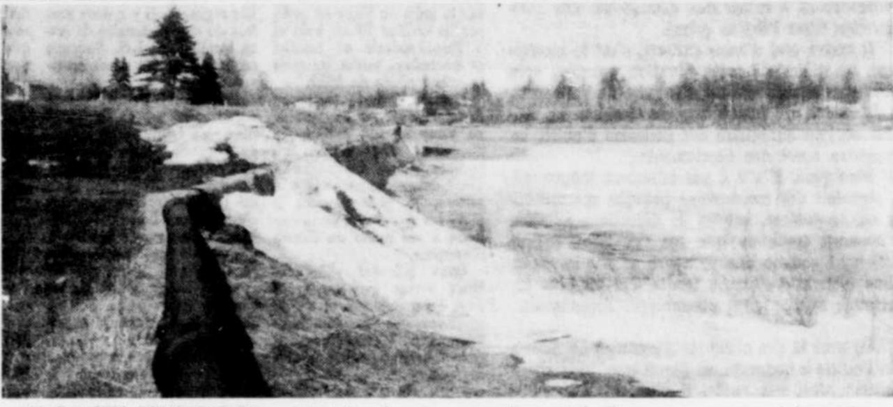
LES DANGERS D'INONDATION semblent écartés cette année, à Drummondville, à moins, bien entendu, que ne survienne une très grosse pluie de plusieurs jours. En effet, la glace a commencé à caler d'elle-même le long des rives de la St-François, et il semble que, dans son état