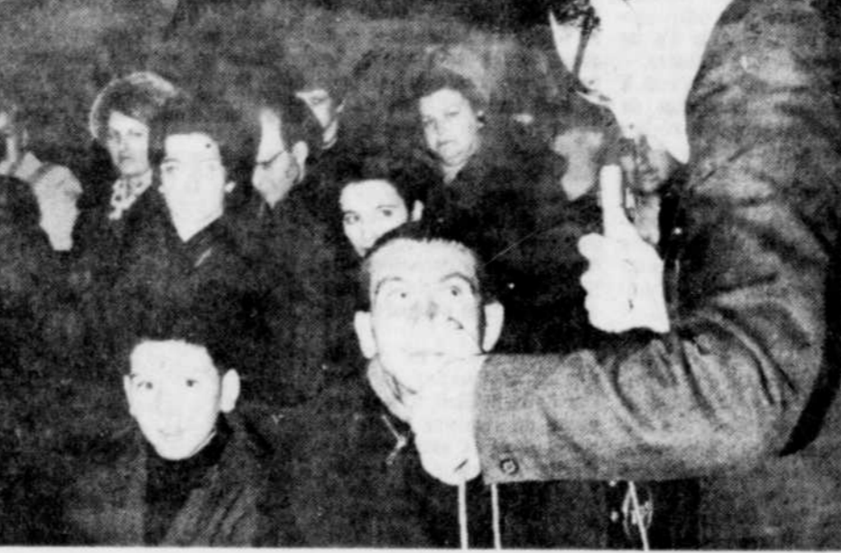
RETRAITE "RENOUVELEE" — "Pas mal mieux que des sermons". Voilà un commentaire recueilli à la suite de la nouvelle retraite de Pâques, animée à l'aide de matériel didactique, dont les paroissiens de Ste-Victoire, à Victoriaville, viennent de profiter.

Cette série de rencontres a été réalisée et animée par les Pères Monfortains de Drummondville.