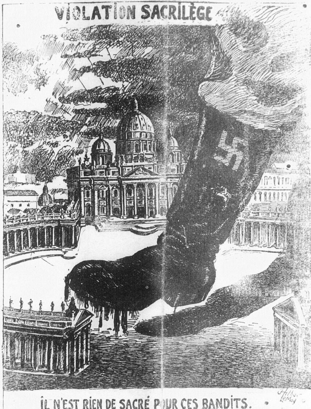
IL N'EST RIEN DE SACRÉ POUR CES BANDITS.