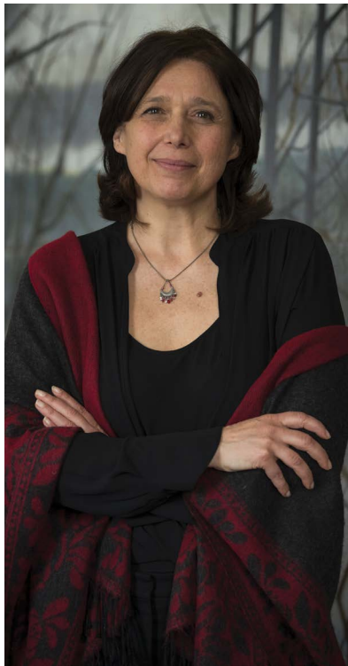
Maja Vodanovic Mairesse d'arrondissement Borough Mayor