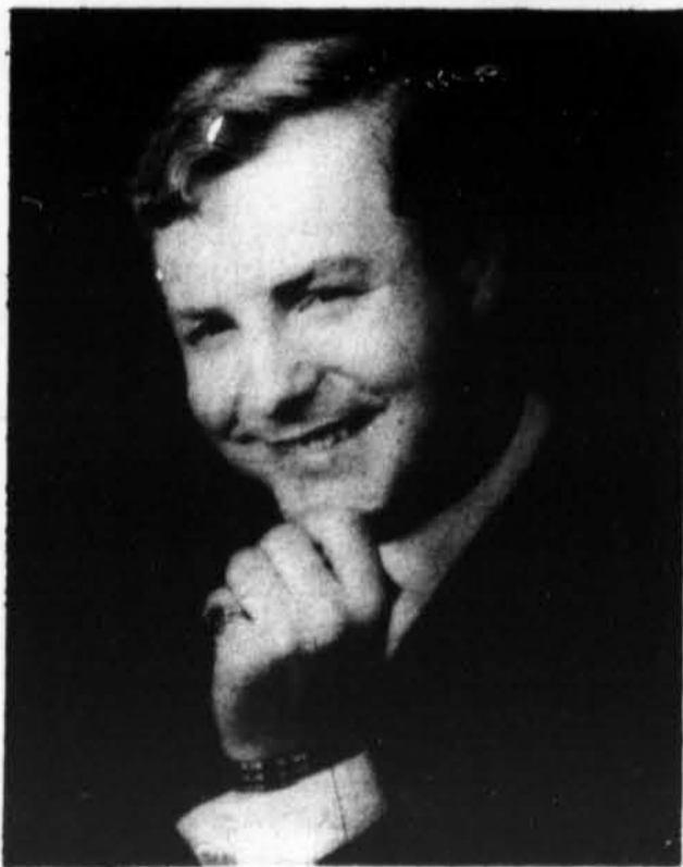
Chanteur artiste des cabarets