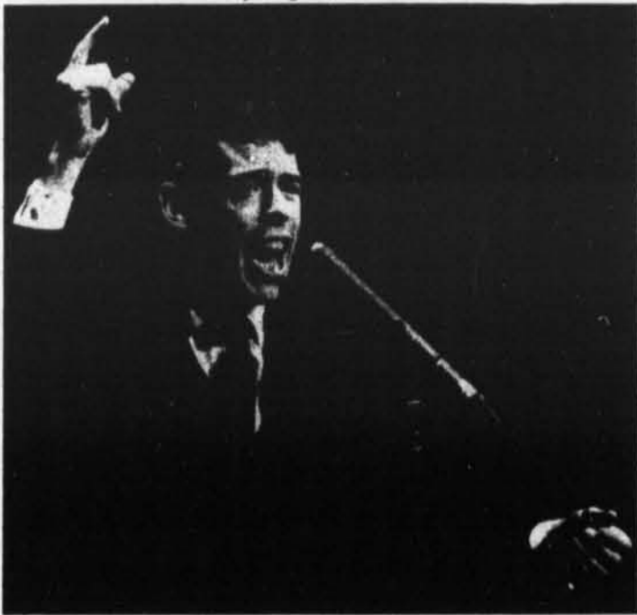
L'émission les Grands Noms du music-hall vous invite à passer une heure en compagnie de Jacques Brel, le samedi 16 juillet à 10 heures. A ce récital télévisé au réseau français de Radio-Canada (récital enregistré à la Comédie Canadienne l'hiver dernier,) Jacques Brel interprétera notamment les Timides , Ne me quitte pas , les Vieux et Le Plat Pays .