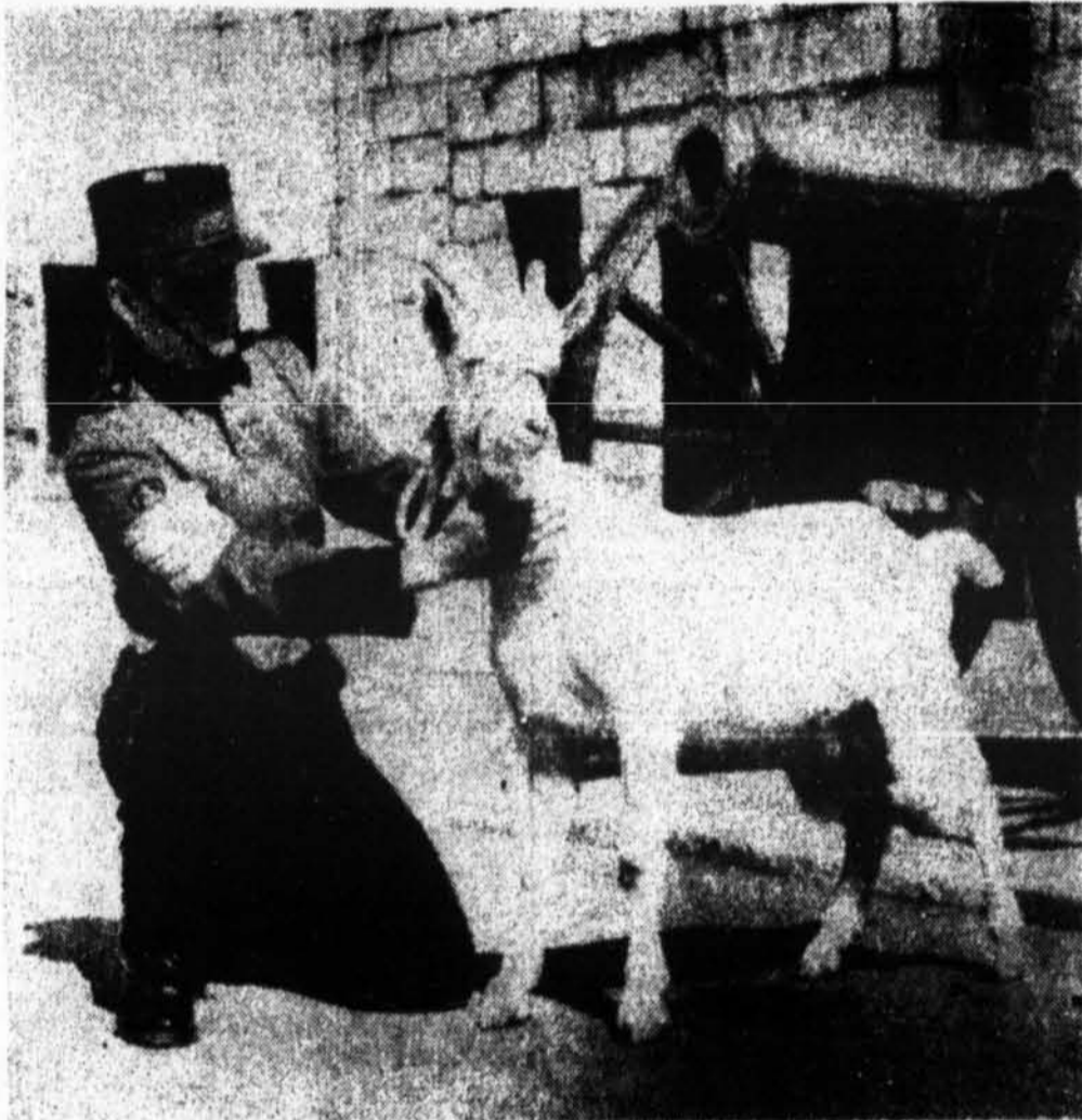
Soyez sans crainte futurs Chevaliers de Colomb, car ce n'est pas la chèvre pour la prochaine initiation mais bien la nouvelle mascotte de la garde d'honneur de Fort Henry. On la surnomme David II.