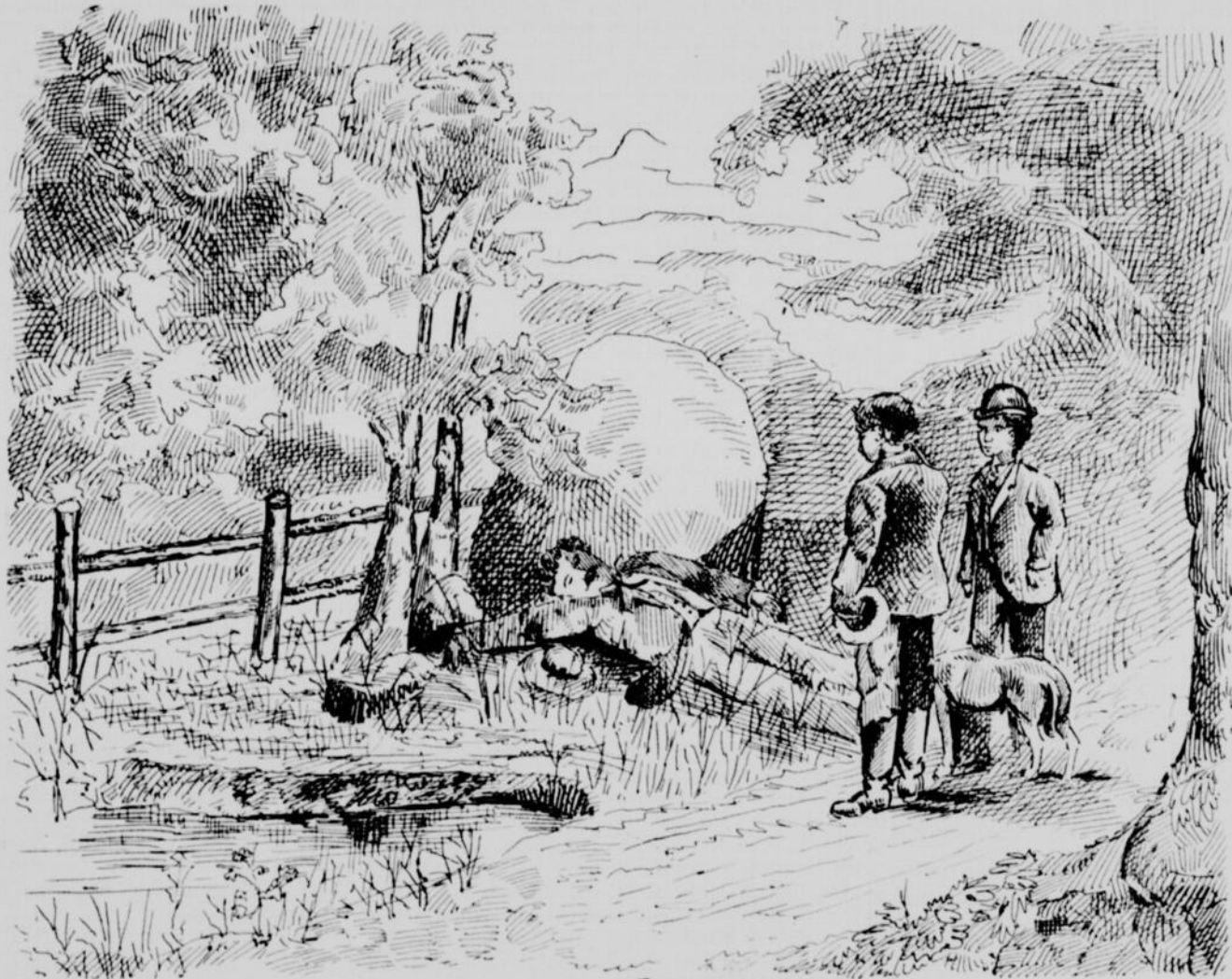
Quelques heures plus tard on apprit que le corps de Chemineau venait d'être trouvé mort — (Voir page 150, col. 1.)

Une chose bizarre, voilà tout... Tandis que nous soupions, nous avons tout à coup aperçu collée aux vitres de notre balcon la face d'un mendiant à la fois ignoble et grotesque. Son expression était telle que