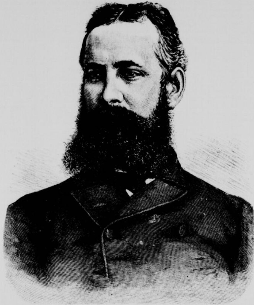
LE LIEUTENANT A. W. GREELY, chef de l'expédition américaine au pôle Nord.

ABONNEMENTS : Six mois : $1.50. — Un an : $3.00.