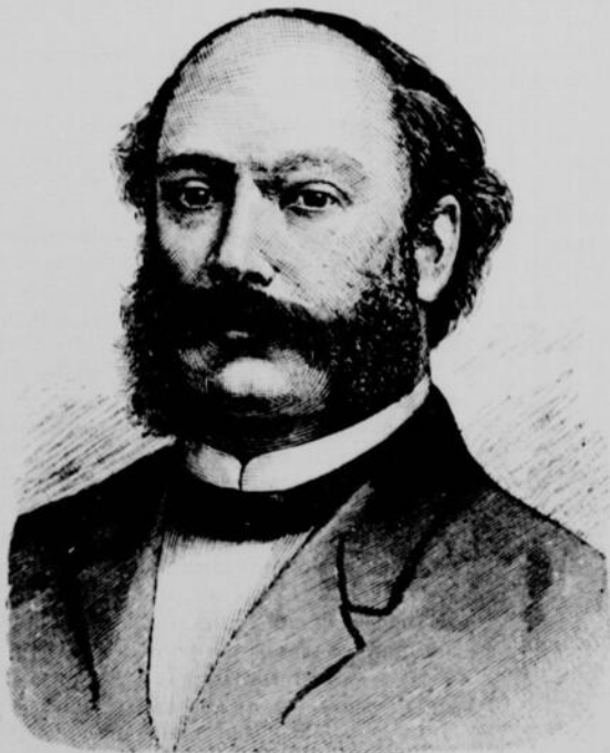
LORD RAYLEIGH, président de l'Association pour l'avancement des Sciences.