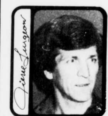
tenses efforts et de sacrifices; s'intéresser à Gaétan Boucher. Et maintenant on va jusqu'à se l'arracher.

Qu'on reconnaisse ses succès. Bravo! Qu'on répare les injustices dont il a pu être victime pendant ces 10 années. Bravo! Qu'on reconnaisse son mérite d'avoir atteint un tel sommet dans sa solitude. Bravo! Gaétan Boucher le mérite, mais il aurait probablement été préférable que toute cette reconnaissance et ce support soient étalés sur ses 10 années de compétitions internationales.