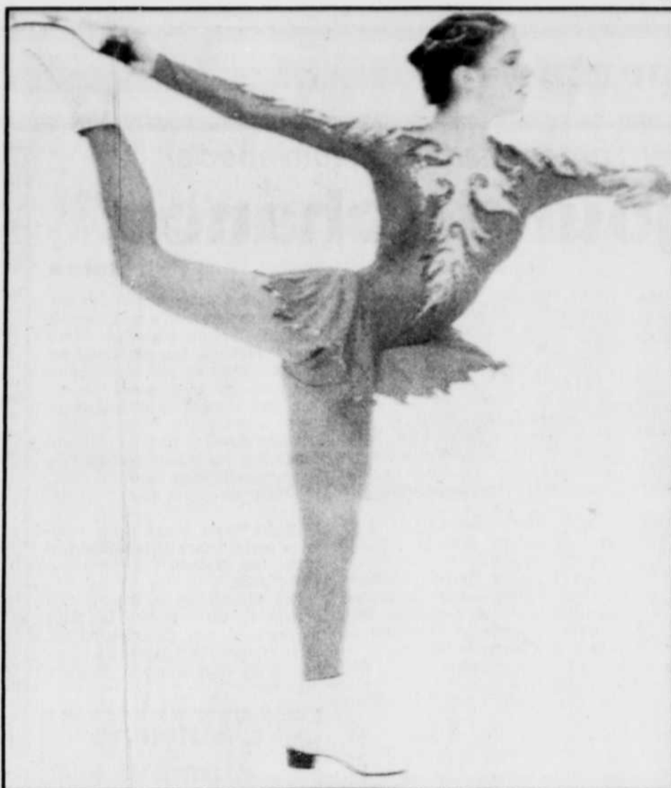
Katarina Witt a été fort spectaculaire