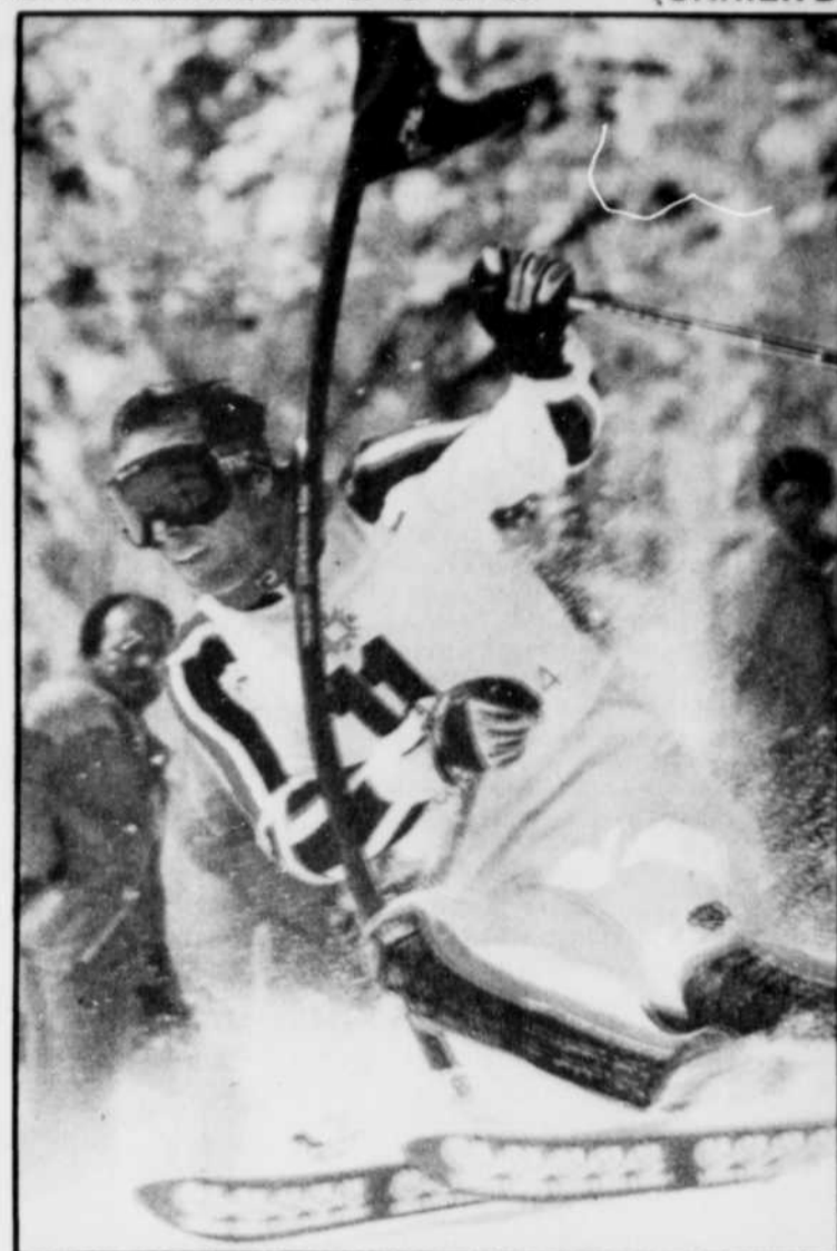
Phil Mahre gagne la médaille d'or