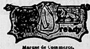
Marque de Commerce.

¶ La confection Semi-ready a plusieurs imitateurs — mais pas de compétiteurs !