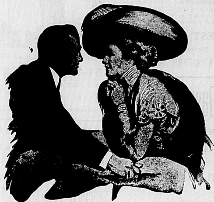
ALPHONSE - MONTREAL

SUCCESSALE AUX TROIS-RIVIERES BUREAU : 56 RUE DES FORGES, NAPOLEON LANGLOIS, GÉRANT.