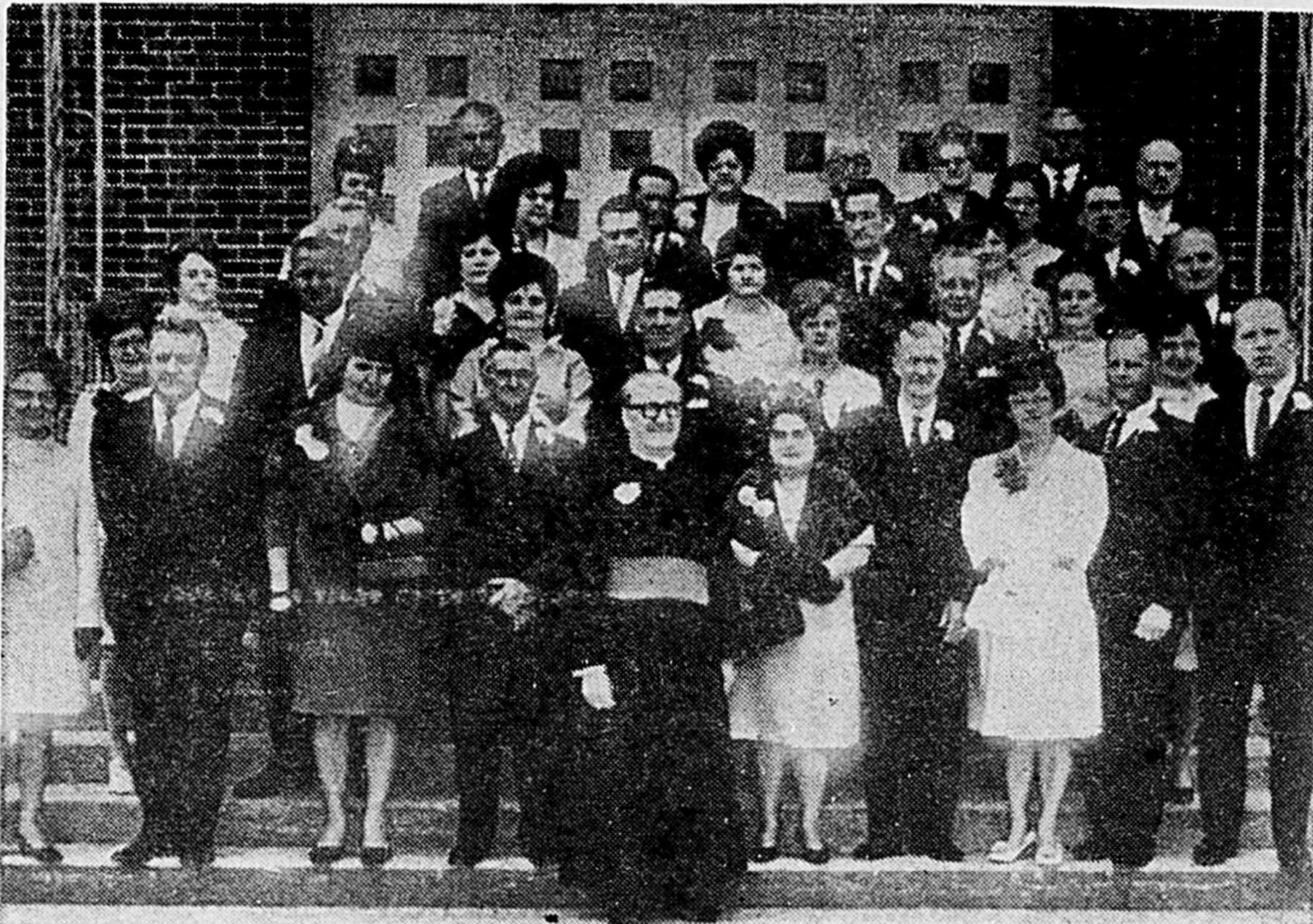
Les 20 couples jubilaires de L'Epiphanie photographiés en compagnie de Mgr Lucien Sylvestre, p.d., curé de la paroisse, au cours de la manifestation paroissiale qui a marqué, di-

manche dernier, cet événement assez particulier (Photo: Studio Laferrière Enrg., L'Epiphanie).