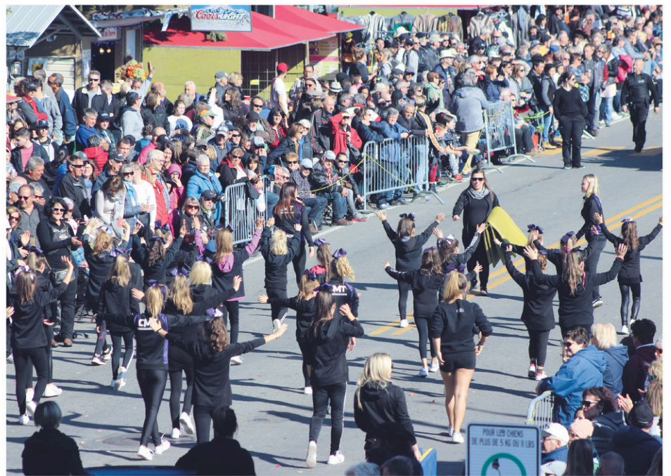
Le Festival de la galette de sarrasin de Louiseville accueille chaque année des milliers de festivaliers.

« À la base, nous avons un festival de rue et on doit composer avec le milieu que nous