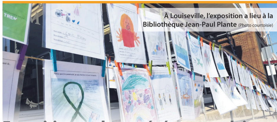
À Louiseville, l'exposition a lieu à la Bibliothèque Jean-Paul Plante

SOLUTIONS À L'ENDETTEMENT. Restez à la maison! Tout se fait en ligne. Trop de dettes? Harcelé par vos créanciers? Reprenez le contrôle. Un seul versement par mois (0% d'intérêt) Bureaux à Trois-Rivières à Grand-Mère et à Louiseville pour vous servir. MNP Ltée, Syndics autorisés en insolvabilité. 819-693-0004