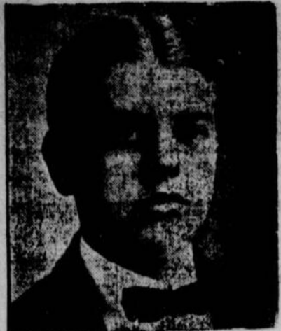
WILLY HOPPE, champion du monde au jeu de billard.

La lutte de mercredi prochain entre ces deux hommes sera donc des plus intéressantes, et tous les amateurs tiendront à ne pas manquer un spectacle comme ils en auront rarement vu de pareils.