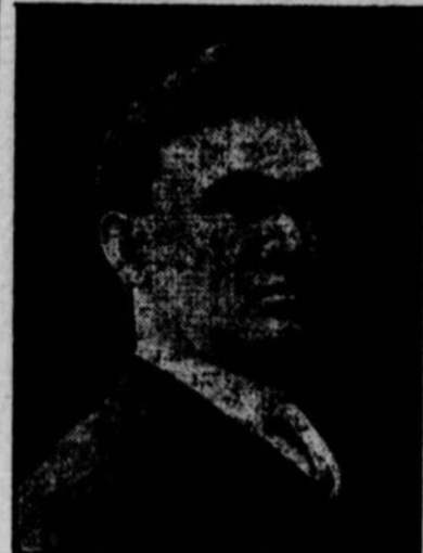
L'INSPECTEUR DE POLICE GRAND-CHAMP, qui vient de faire acte de soumission complète à Monseigneur l'Archevêque.

Si la Commission d'enquête avait eu le loisir de faire un rapport, elle eût, dit-on, recommandé que Grandchamp fût exonéré et maintenu dans ses fonctions.