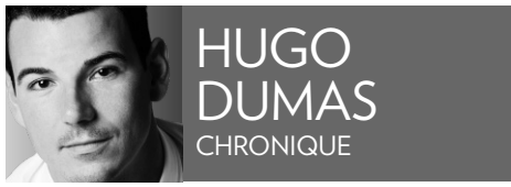
HUGO DUMAS CHRONIQUE

C'était à l'été 2009. Le maire de Huntingdon, le coloré Stéphane Gendron, a ciré sa belle Mustang noire décapotable et avalé – pendant 20 jours – des kilomètres d'asphalte partout au Québec à la recherche de villages accablés de divers maux : usines vides, écoles désertes, fermes abandonnées faute de relève.