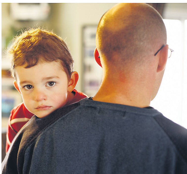
Enfants de soldat , de Claire Corriveau, s'intéresse à quatre familles de militaires canadiens.

« Elles avaient à peine 7 ans quand elles ont été enlevées. Des petites filles qui suçaient encore leur pouce », note la réalisatrice qui a consacré