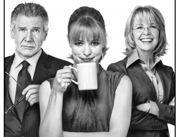
Rachel McAdams Harrison Ford Diane Keaton