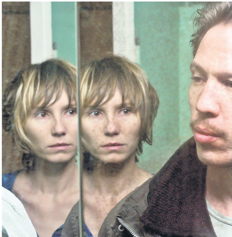
Qu'un seul tienne et les autres suivront

16 e FESTIVAL CINÉMANIA – NOS SUGGESTIONS