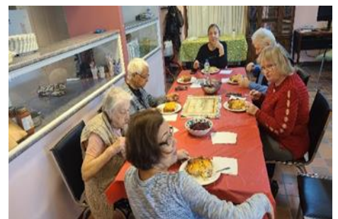
Cuisine-partage HLM Isabella