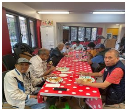
Cuisine-partage HLM Plamondon