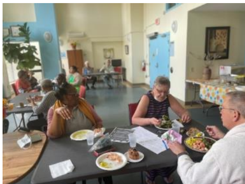
Cuisine-partage HLM Goyer

Comme la fin d'année s'annonce, nous avançons les repas de Noël par les Cuisines-partage pour rassembler les aînés des HLM et leur donner un avant-goût des fêtes de fin d'année.