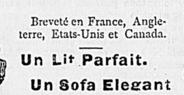
Un Lit Parfait. Un Sofa Elegant

N'a ni pieds ajustés, ni supports factices, ni tirettes ou autres ajoutes qui dans d'autres canapés à lits occasionnent tant de dérangements et manquent de solidité et de confort, possède une place aménagée à l'intérieur pour mettre tout le nécessaire à faire le lit ; Tous déclarent l'invention admirable. Le sofa-lit Hover est un lit complet, combinant un matelas en crin, avec un matelas de 48 à 60 ressorts. Le sofa-lit Hover est un sofa de salon, en noyer noir solide, élégant et moelleux. LE SOFA-LIT HOVER est indispensable dans toute maison où une chambre d'étrangers fait défaut ; en cinq minutes on peut monter un excellent lit dans la pièce où le Hover sofa-lit se trouve placé. LE SOFA-LIT HOVER est le desideratum de toutes les personnes qui n'occupent qu'une seule pièce. A l'aide de ce meuble elles possèdent un salon ou une chambre à coucher. LE SOFA-LIT HOVER est une trouvaille pour les familles qui vont en villégiature ; inutile de déménager les lits encombrants à leurs accessoires. (Le sofa-lit se compose de cinq pièces, s'ajustant comme les couchettes ordinaires ; démonté il prend peu de place.) Nous recommandons à toute personne qui désire acheter un sofa-lit Hover de nous laisser leur commande maintenant, et ainsi s'éviter tout retard à l'époque de la livraison. Prix de $20 à $75. Conditions faciles et avantageuses. S'ADRESSER AUX ATELIERS DE LA Compagnie Universelle des Commodes-Cabinets 39 Rue St Sacrement, Coin de la Rue St Nicholas.