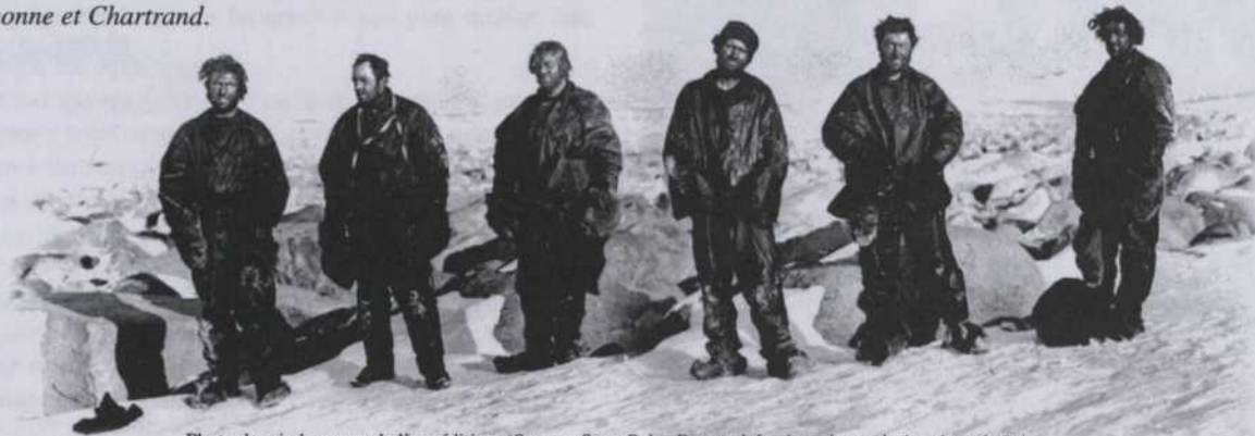
Photo des six hommes de l'expédition.