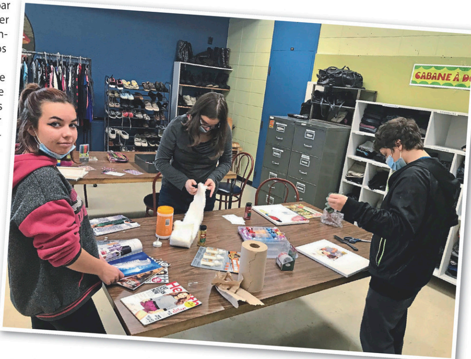
On a créé une maquette pour se projeter positivement dans le futur.