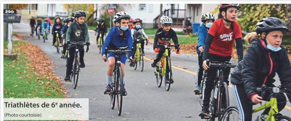
Triathlètes de 6 e année.

Dernièrement, l'école Paradis a été reconnue par Triathlon Québec comme un club officiel. Nous en sommes très fiers et remercions toutes les personnes qui nous permettent de grandir et de nous développer dans ce milieu.