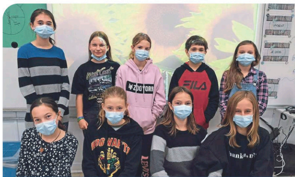
École Tournesol Une école qui brille PAGE 12