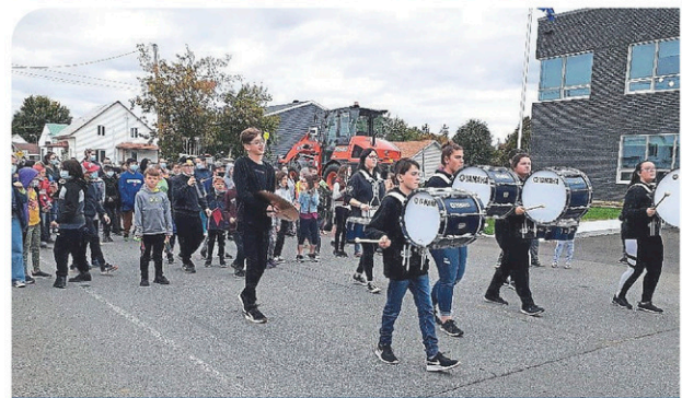
École Marquis Nouveauté et défis au menu! PAGE 13