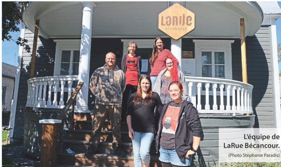
L'équipe de LaRue Bécancour.

Avec comme objectif de faciliter la tenue de ces activités et ateliers, une nouvelle cuisine a été aménagée dans les anciens bureaux ainsi qu'un garde-manger avec une plus grande capacité. « La cuisine collective est un must pour aider nos gens à