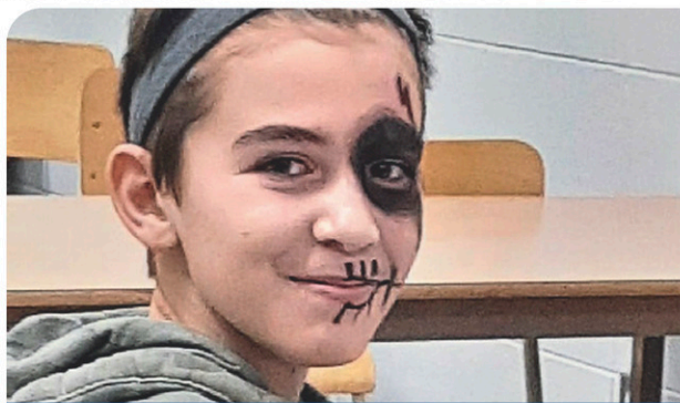
École secondaire Les Seigneuries Des activités pour tous les goûts le midi PAGE 10