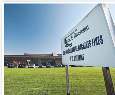
L'école de mécanique de machines fixes.