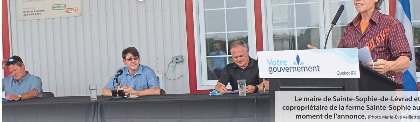
Le maire de Sainte-Sophie-de-Lévrard et copropriétaire de la ferme Sainte-Sophie au moment de l'annonce.

MARIE-EVE VEILLETTE meveillette@icimedias.ca