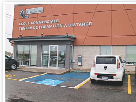
L'école commerciale.

Psst! À l'École commerciale, nous offrons aussi l'enseignement synchrone. Tous les avantages de l'école, mais dans le confort de ta maison. Communique directement avec nous afin d'avoir plus de détails au 819 293-5821, poste 2364.