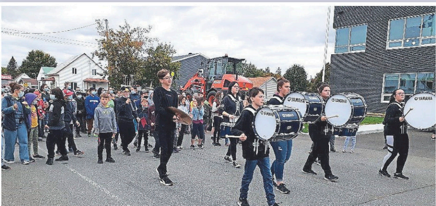
Les élèves de la fanfare de l'école secondaire La Découverte ont été invités par le Comité organisateur de la rentrée à venir célébrer l'inauguration de l'école Marquis, lors de l'événement Tintamarre, le 1 er octobre dernier.

Tant de nouveauté représente un grand défi, car les élèves découvrent les différences et difficultés de certains élèves, d'où l'importance d'en parler pour mieux la comprendre, ce qui demande de l'adaptation et du temps. De grands défis que l'ensemble du personnel de l'école relève au quotidien, un jour à la fois.