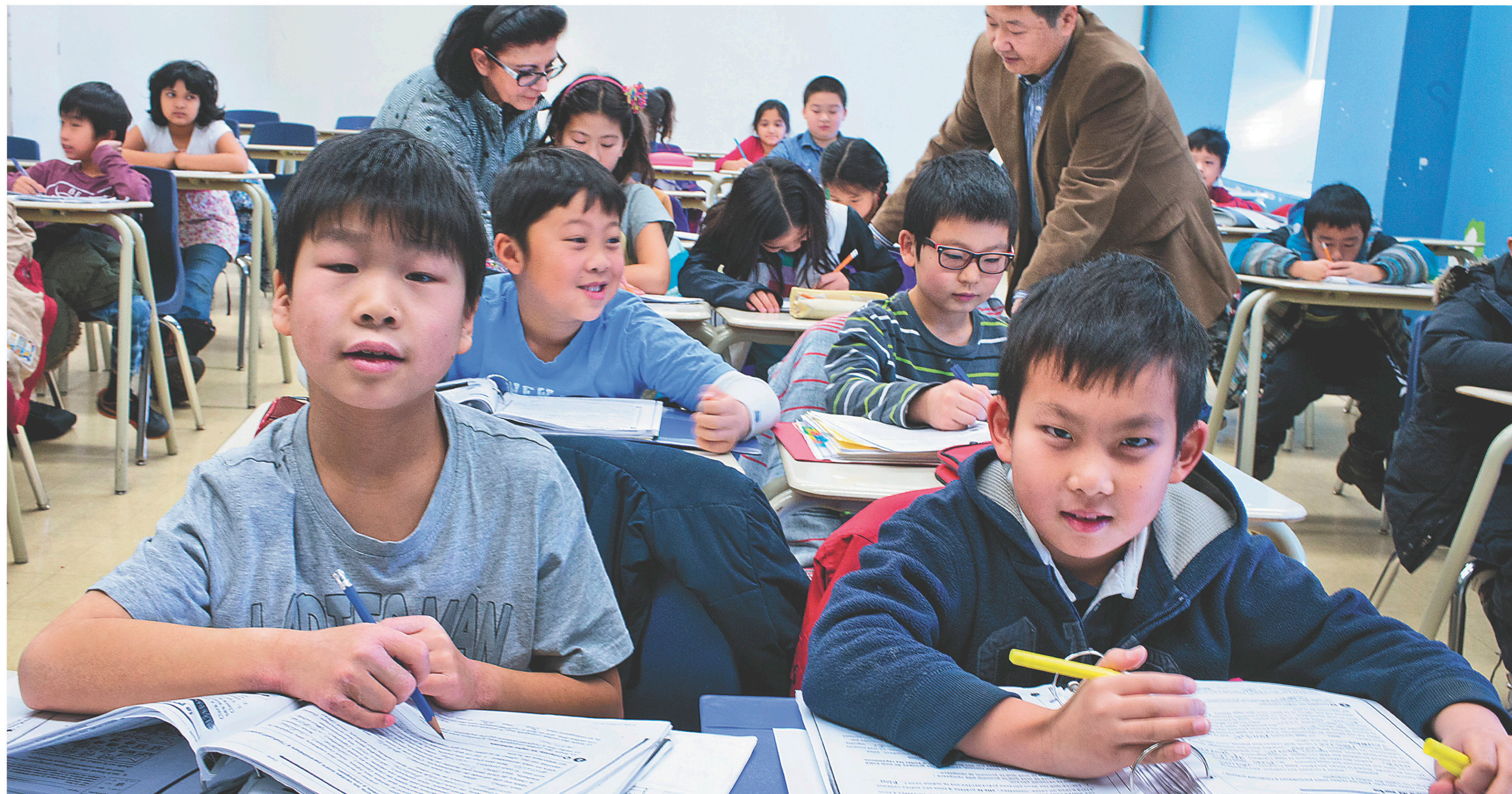
Des photos prises dans les classes du collège Elite, installées au cégep de Saint-Laurent à Montréal.