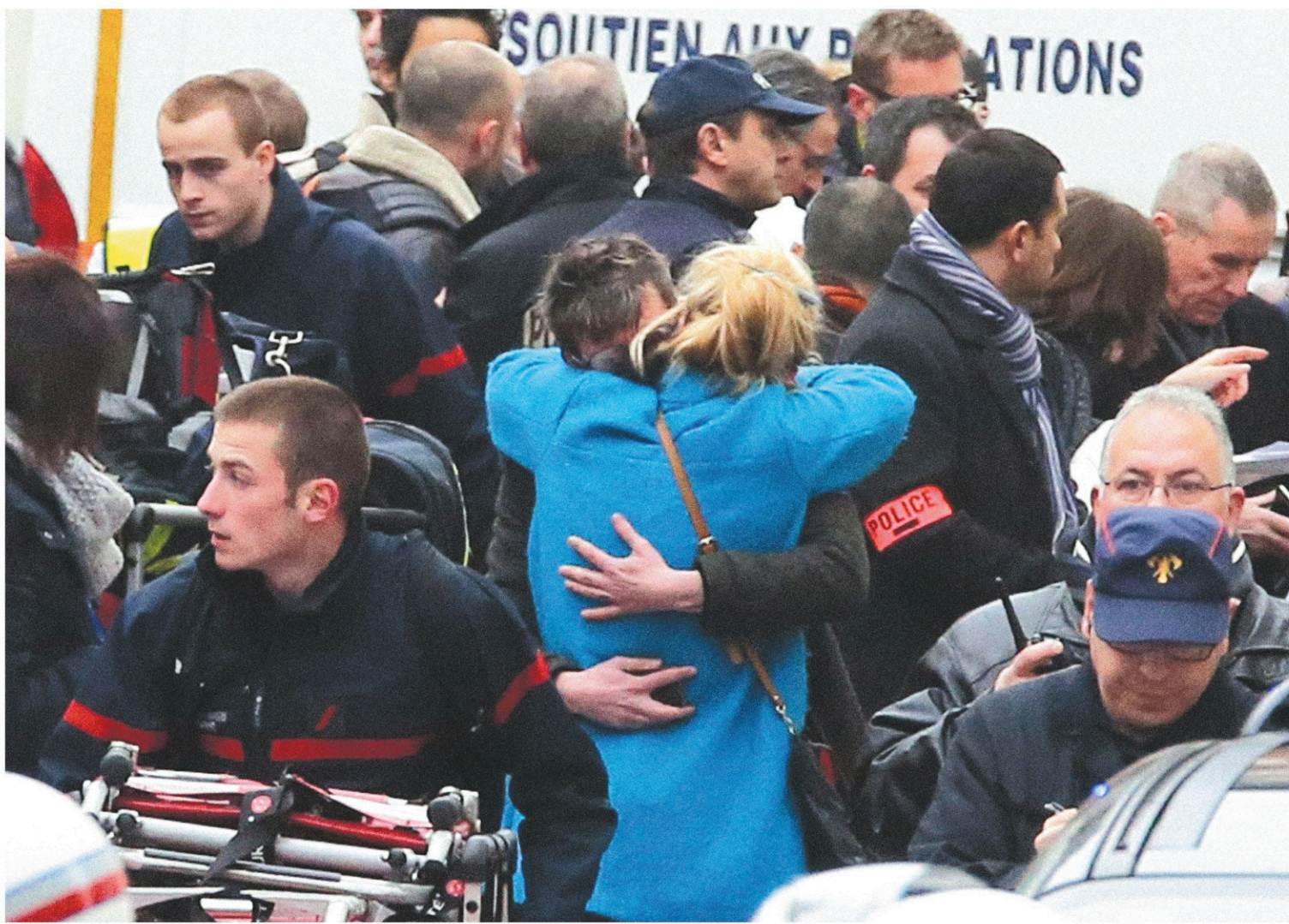
Deux personnes se réconfortent au cœur de la tourmente devant l'immeuble du Charlie Hebdo, le 7 janvier 2015.