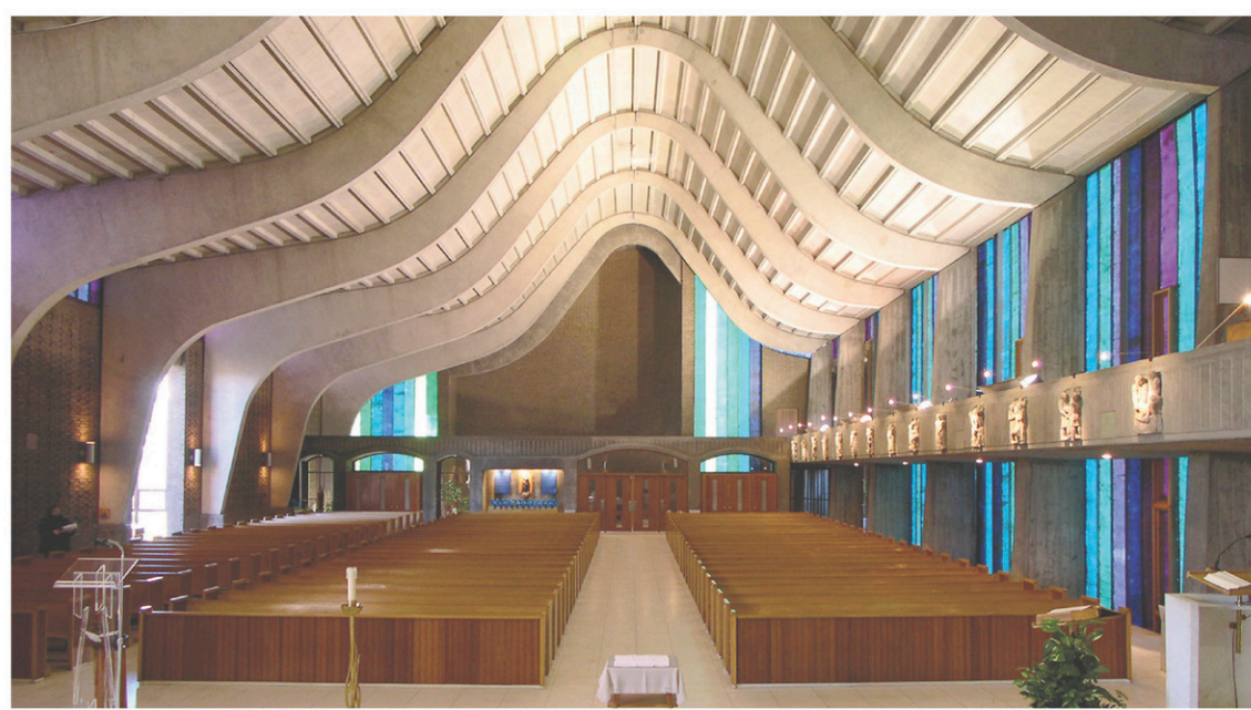
CONSEIL DU PATRIMOINE RELIGIEUX DU QUÉBEC