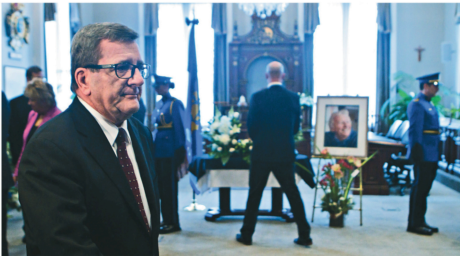
Le maire de Québec, Régis Labeaume, a rendu hommage à l'ancien maire de la capitale.