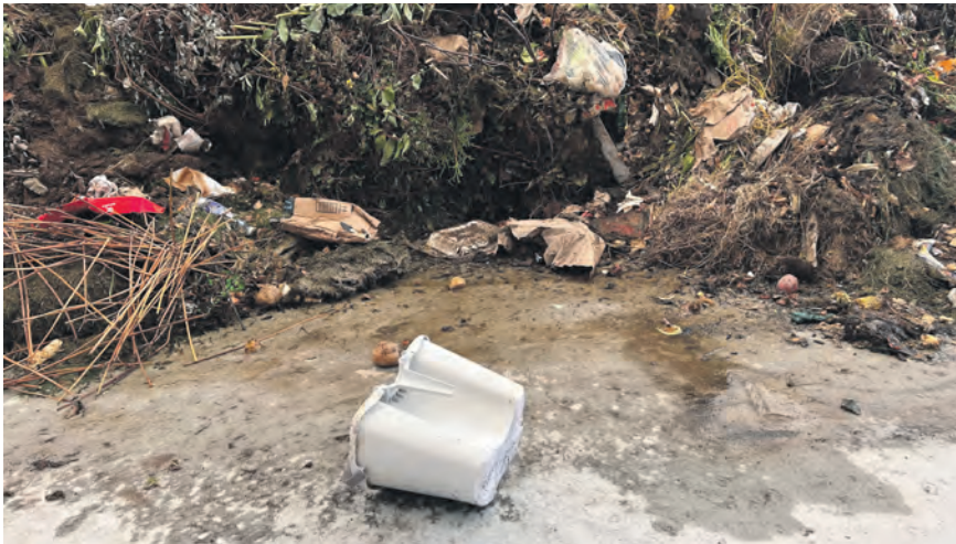
Certains citoyens n'ont pas vu que les bacs à compost de comptoir étaient «cachés» dans leur bac à compost à roulettes...