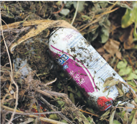
Les cannettes de toutes sortes ne se recyclent pas, même si leur contenu, techniquement, pourrait l'être.