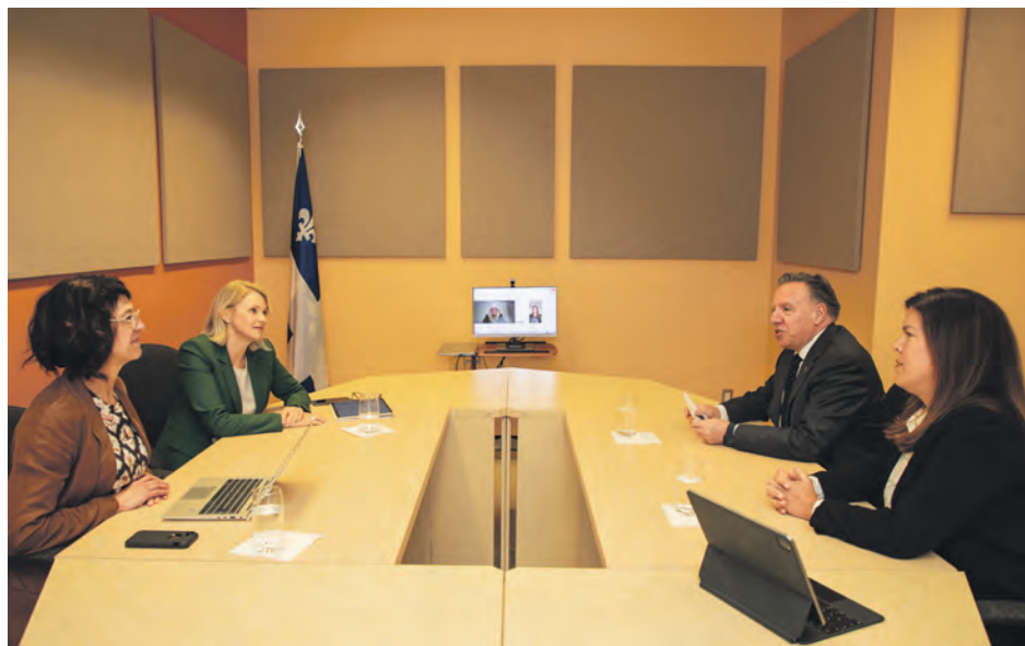
Le premier ministre François Legault a rencontré le CISSS de la Côte-Nord le 20 septembre 2024 à Baie-Comeau.

Le premier ministre du Québec laisse entendre que des annonces pourraient bientôt se faire afin de proposer des «solutions permanentes» en santé pour la Côte-Nord.