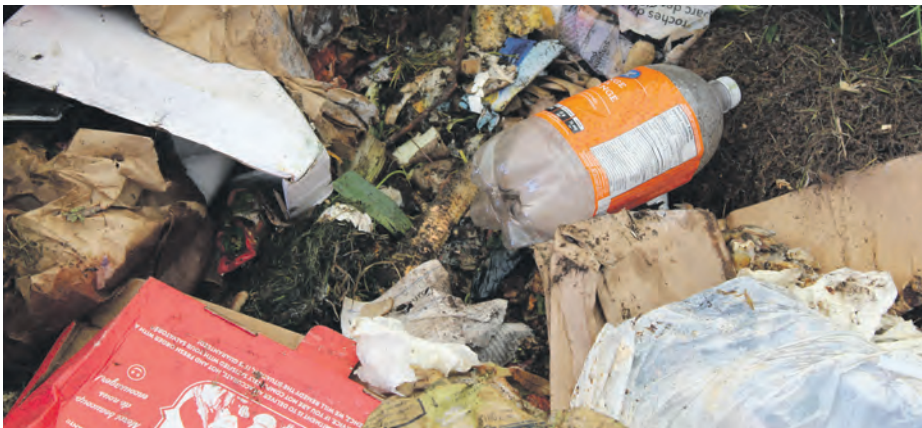
Les boîtes de carton souillées de résidus alimentaires comme les boîtes à pizza sont les bienvenues dans le compost, mais les bouteilles de plastique doivent prendre le chemin du recyclage.