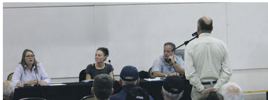
Les citoyens ont échangé avec les trois représentants de Métaux Torngat lors d'une séance d'information à l'école Bois-Joli, le 18 septembre.

dernière. Son commentaire lui a valu des applaudissements de la quarantaine de personnes présentes.