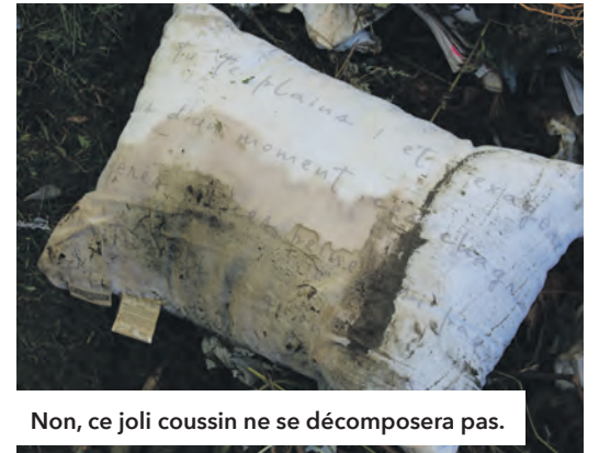
Non, ce joli coussin ne se décomposera pas.