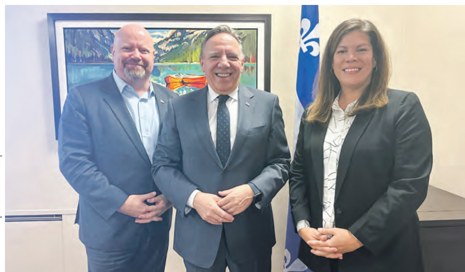
Le ministre Ian Lafrenière, le premier ministre François Legault, et la ministre Kateri Champagne Jourdain, le 20 septembre, à Baie-Comeau.