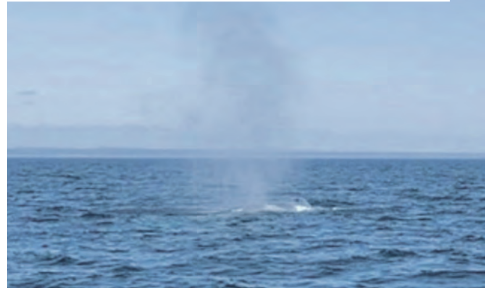
Ces photos ont été relayées par un internaute préoccupé.

Une loi et deux règlements fédéraux visant à protéger les mammifères marins s'appliquent dans le Saint-Laurent et le fjord du Saguenay : la Loi sur les espèces en péril et le Règlement sur les mammifères marins (Pêches et Océans Canada), ainsi que le Règlement sur les activités en mer