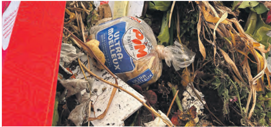
La démarche était presque parfaite, ne restait qu'à sortir le pain du sac!