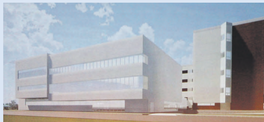
Modélisation du projet de modernisation et d'agrandissement de l'Hôpital de Sept-Îles présentée par le CISSS Côte-Nord.

Au printemps, la vente de l'hôtel de ville au CISSS de la Côte-Nord a permis de débloquer la suite des choses pour l'Hôpital de Sept-Îles. Il fallait plus d'espace pour du stationnement, en vue de la construction d'un nouveau bâtiment d'environ 2500 m 2 . Dans celui-ci, on nous promet modernité pour remplacer l'urgence actuelle particulièrement désuète et tout sauf optimale pour les travailleurs de la santé.