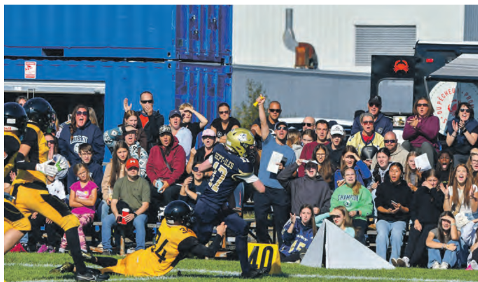
Les partisans étaient très nombreux pour le premier programme local du Husky football de l'école Jean-du-Nord/Manikoutai de Sept-Îles.

L'entraîneur-chef a parlé de manque d'exécution et de jeux de base ratés au sujet de sa troupe qui aligne