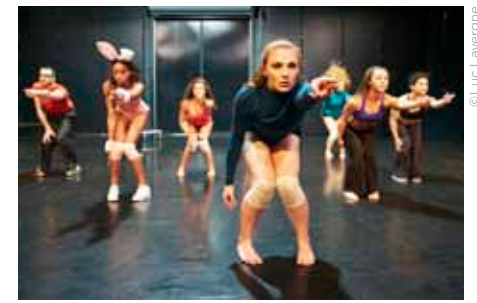
Dances de mai

Rendez-vous avec les interprètes qui constituent la relève de la danse contemporaine québécoise. Les finissants de 2014 de l'École de danse contemporaine de Montréal s'appêtent à faire le grand saut dans le monde professionnel. Trois créations originales signées Marc Boivin, Noam Gagnon et Sasha Kleinplatz.