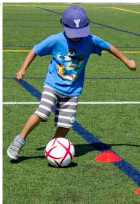
Atelier de soccer du Camp YMCA