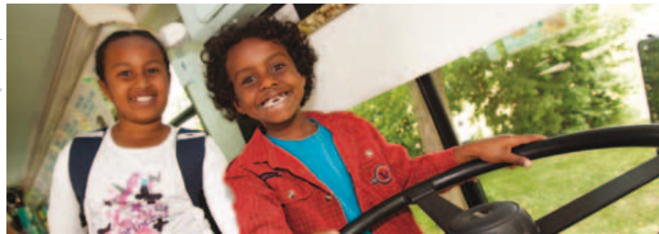
Journée des musées montréalais

Le dimanche 25 mai, un grand nombre d'institutions muséales ouvriront gratuitement leurs portes à la population. Outre les expositions, une myriade d'activités et d'événements (animations, ateliers, démonstrations, dégustations) seront offerts. De plus, un service de navette, mis sur pied par la Société de transport de Montréal, sera offert toute la journée à la promenade des Artistes dans le Quartier des spectacles.