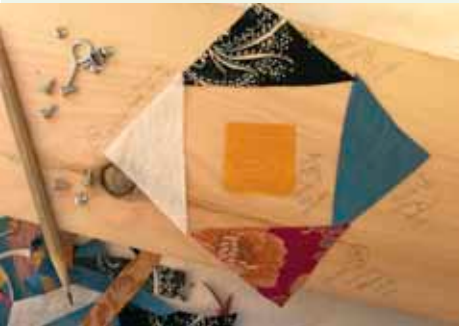
Œuvre en cours de production, 2013, médiums mixtes

Traditionnellement, les Coréens donnaient des significations aux couleurs; le rouge, le bleu, le blanc, le noir et le jaune étaient associés à des symboles précis. Les artistes Jihee Min, Jinyoung Kim et Heeseung Ko proposent une évolution de cette tradition et attribuent de nouvelles significations aux couleurs.