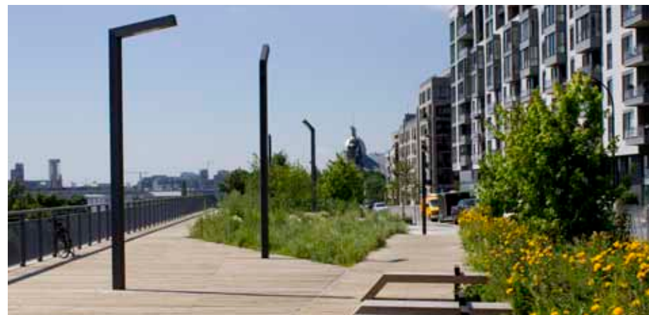
Le nom du Chemin-Qui-Marche est inspiré d'une expression amérindienne faisant référence au Saint-Laurent.

Le belvédère du Chemin-Qui-Marche a remporté un prix Mérite national , dans la catégorie Design , de l'Association des architectes paysagistes du Canada (AAPC). Ce projet s'est démarqué par l'originalité de son design, une recherche avant-gardiste et un souci pour le développement durable. Il a permis de redonner un lustre à la zone industrielle au sud de la rue de la Commune Est et à l'est de la rue Berri. Aujourd'hui, Montréalais et touristes bénéficient d'un lieu de promenade et de détente convivial et sécuritaire, d'un nouvel espace vert linéaire qui offre des vues magnifiques sur la ville et le fleuve.