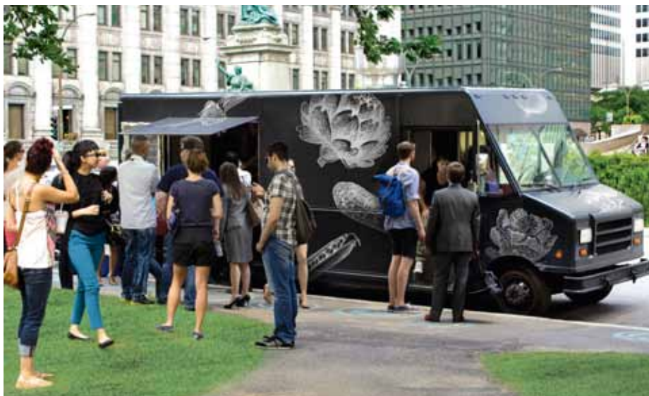
Cuisine de rue