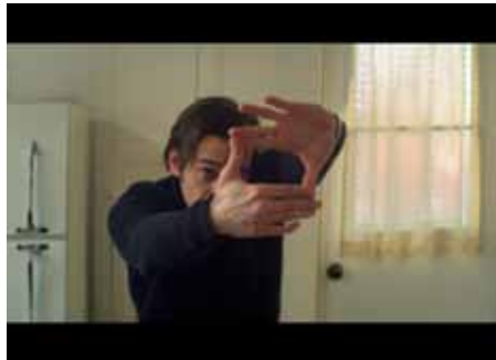
Chasse au Godard d'Abbittibbi