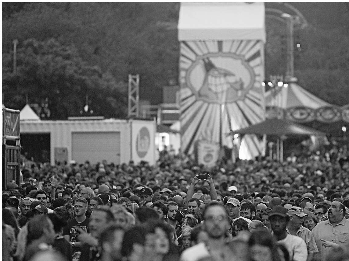
Parmi les moments forts de l'événement 2014, nul doute que la performance historique de Rock et Belle Oreilles, mercredi dernier sur la place des Festivals, aura frappé les esprits.

« Avec 250 000 personnes en salles et 1,35 million de visiteurs dans les rues, c'est un phénomène unique au monde, a dit Gilbert Rozon. D'avoir du jeu, de la bouffe, les galas Juste pour rire, les galas Just for Laughs, Zoofest, le ComicPro et la rue, ça donne un festival incomparable dont