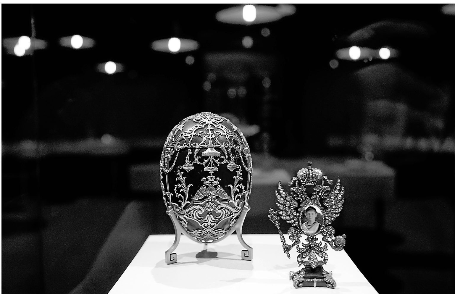
Le clou de l'exposition réside dans les œufs impériaux Fabergé; ils symbolisent encore le nec plus ultra du raffinement.

Dans cette salle, on peut admirer les objets fantaisie de Fabergé: petits chiens en obsidienne ou fleurs en or et saphirs, des objets assez