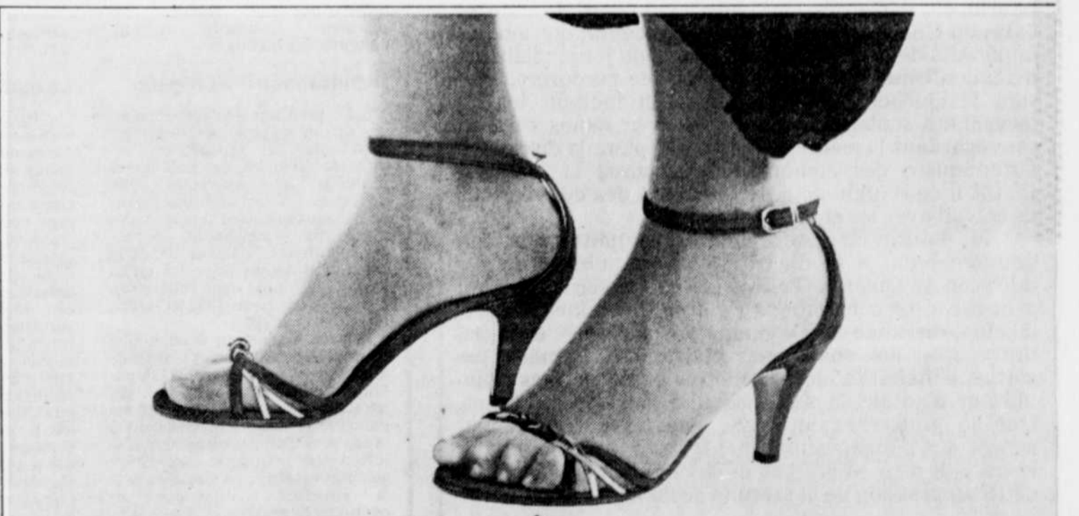
DISPONIBLE DANS LA MAJORITÉ DE NOS MAGASINS