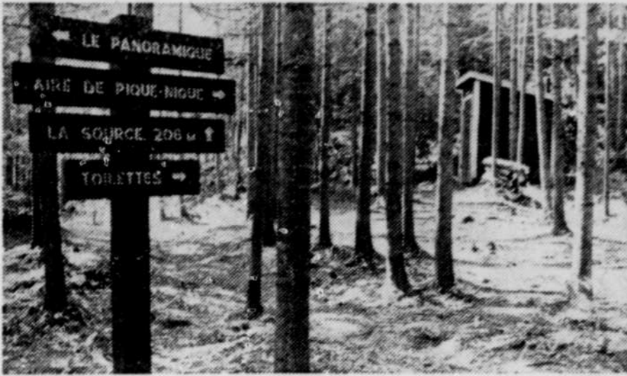
Le Soleil, Jean Vallières