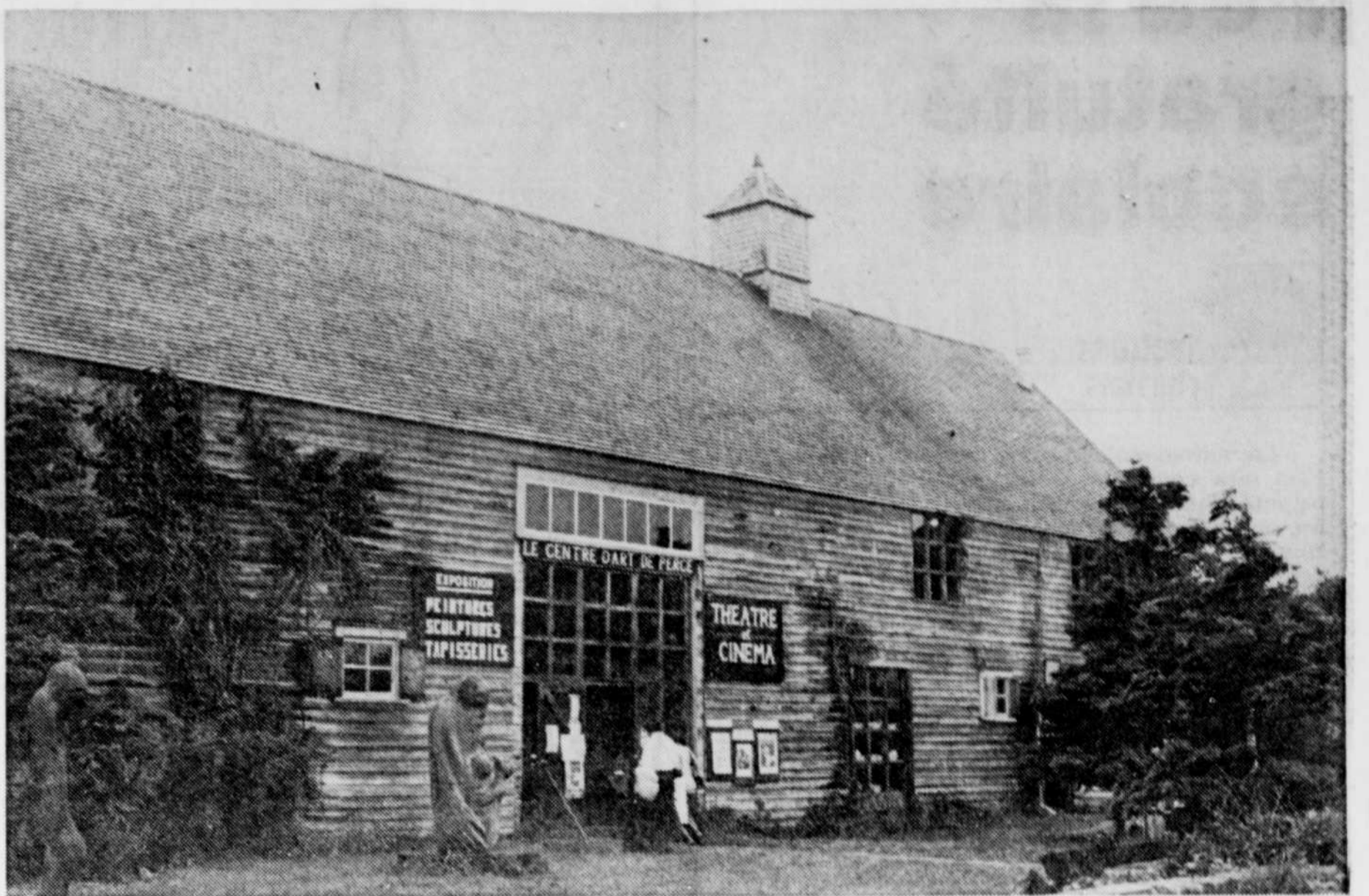
Le centre d'art de Percé.