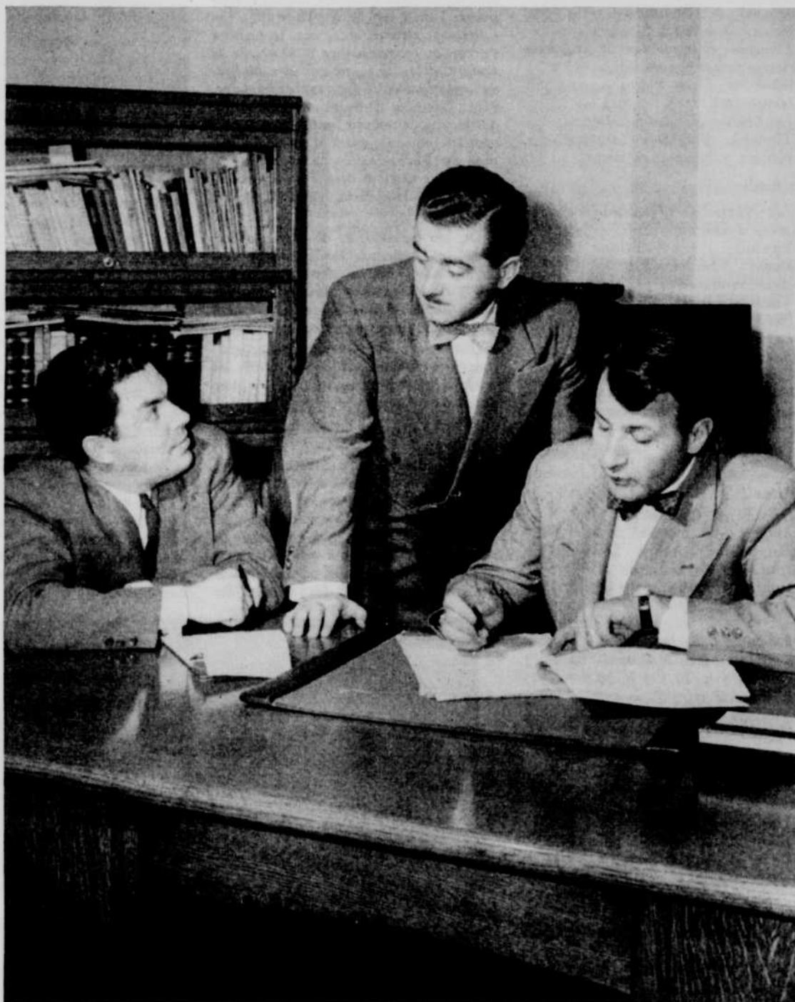
Le directeur et les deux réalisateurs de Radio-Collège

Le concours de chant de Nos futures étoiles , fondé il y a quatre ans par Radio-Canada pour découvrir et faire connaître les plus doués de nos jeunes chanteurs, obtient chaque année un très vif succès. Comme par les années passées, au cours de la série de con-