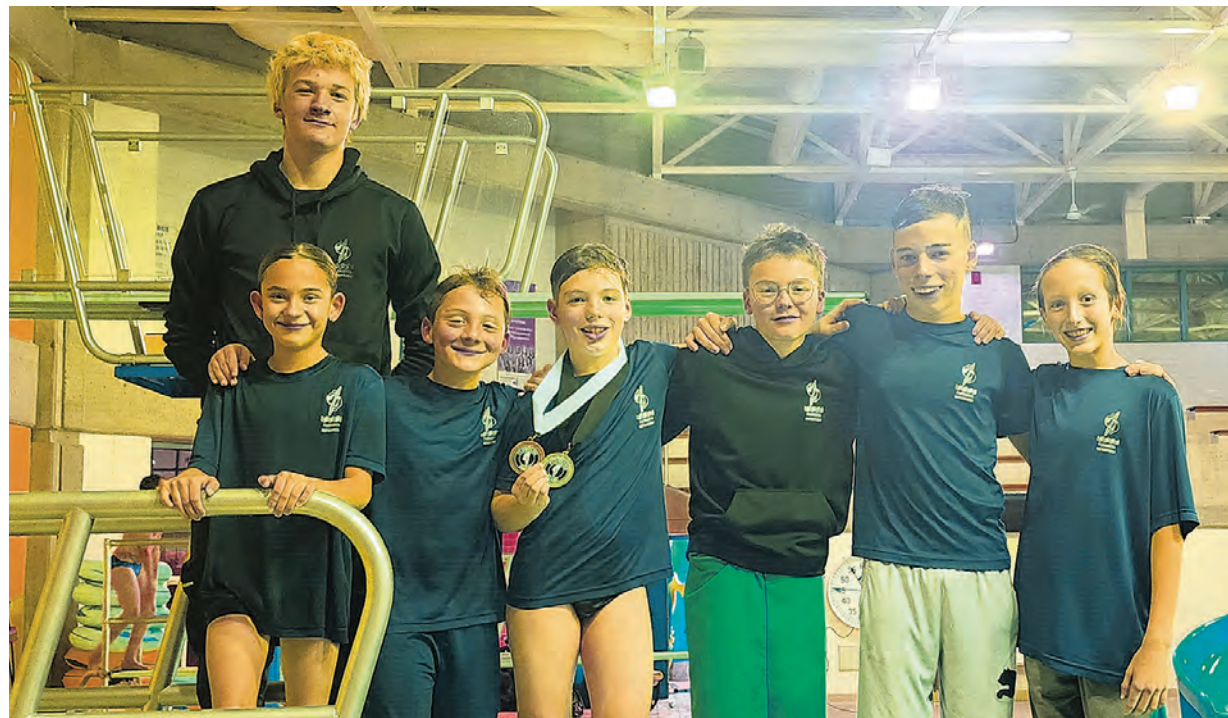
D'autres plongeurs du Club de Plongeon Repentigny se sont également distingués.

Le Club de plongeon Repentigny est un club dynamique et passionné qui vise à promouvoir le sport du plongeon et à développer les talents des jeunes athlètes. Situé à Repentigny, le club offre un environnement d'entraînement stimulant et un encadrement de qualité, permettant aux plongeurs de tous les niveaux de se surpasser et d'atteindre leurs objectifs. Il compte aujourd'hui plus de 120 plongeurs dont plusieurs athlètes se sont démarqués par leur performance de haut niveau, au fil des années. Pour plus d'informations sur le Club de plongeon Repentigny, ses activités et ses performances, veuillez contacter Ludovick Ian Giguère au 514 686-1177.