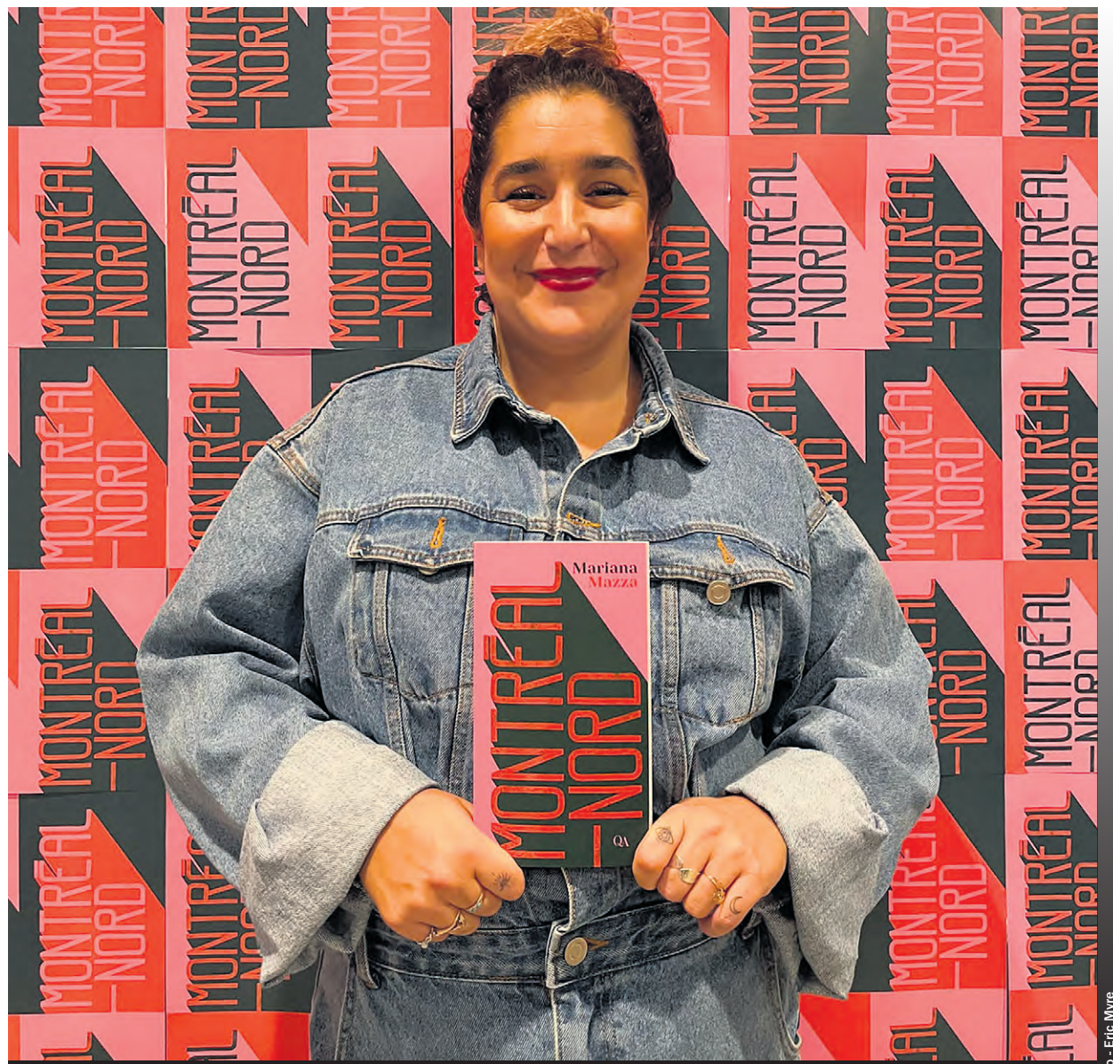
Mariana Mazza sera de passage à Repentigny le 18 janvier.

Si tu as la passion, le temps et l'envie de travailler, vas-y. Moi j'ai toujours foncé, mais je ne veux pas imposer mes conseils et j'évite de porter un jugement sur les