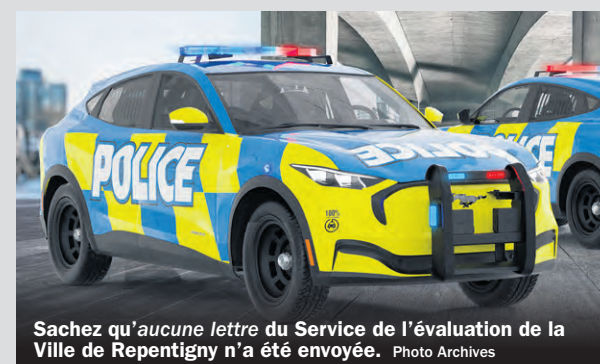
Sachez qu'aucune lettre du Service de l'évaluation de la Ville de Repentigny n'a été envoyée.

Sachez qu'aucune lettre du Service de l'évaluation de la Ville de Repentigny n'a été envoyée en ce moment et qu'aucun paiement ne vous serait demandé pour la livrai-