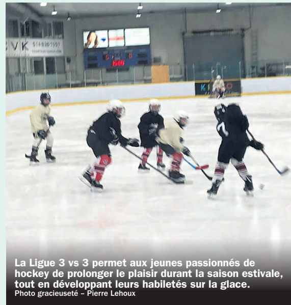
La Ligue 3 vs 3 permet aux jeunes passionnés de hockey de prolonger le plaisir durant la saison estivale, tout en développant leurs habiletés sur la glace.