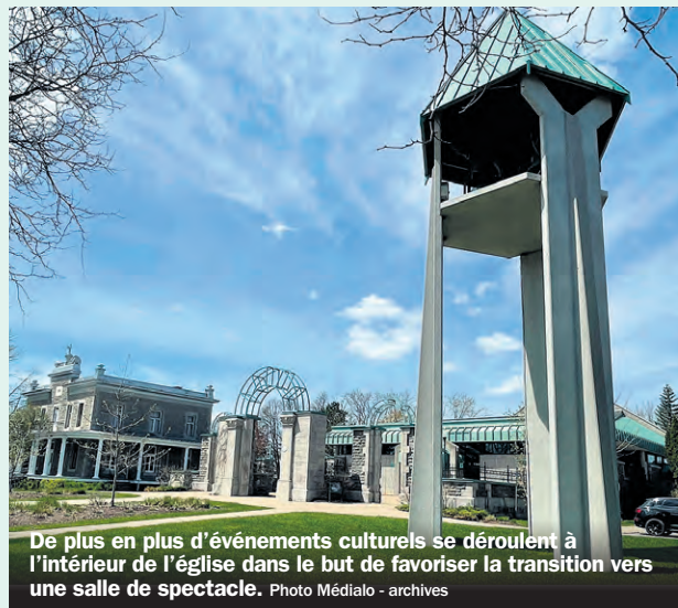
De plus en plus d'événements culturels se déroulent à l'intérieur de l'église dans le but de favoriser la transition vers une salle de spectacle.

Outre cette mesure, la Ville mettra sur pied en 2024 une campagne de financement, en plus de poursuivre son travail de recherche de subventions pour soutenir la réalisation du projet. Si tout se déroule bien, des mandats pour la préparation des plans et devis pourraient être