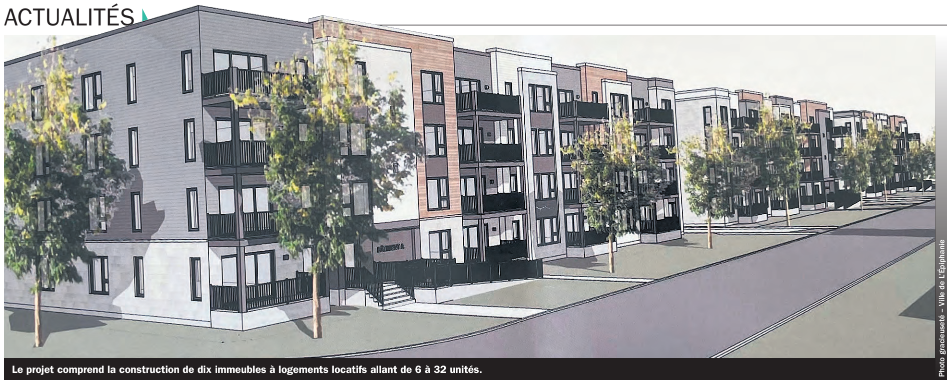
Le projet comprend la construction de dix immeubles à logements locatifs allant de 6 à 32 unités.