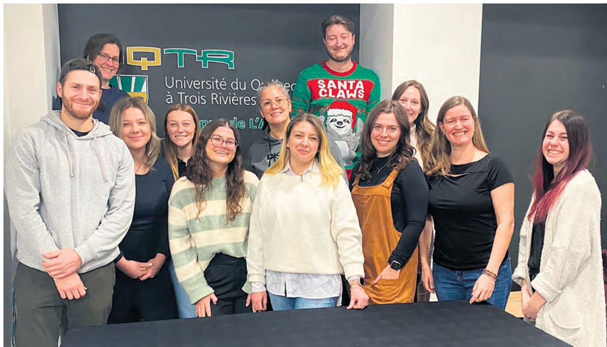
Les douze finissants du baccalauréat en enseignement en adaptation scolaire et sociale.