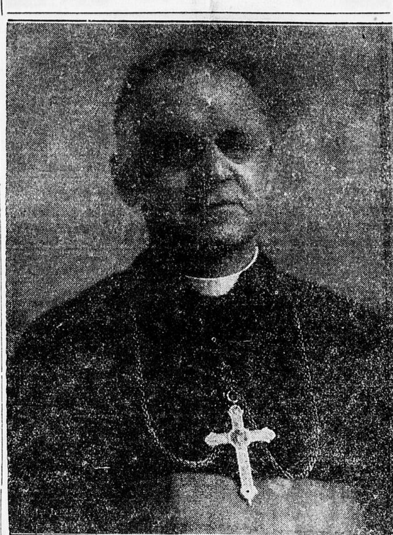
Son Excellence Mgr Forbes, archevêque d'Ottawa, président d'honneur de la célébration de la fête nationale de la capitale. Mgr Forbes officiera à la messe pontificale, le matin du 25 à l'église St-Charles d'Ottawa. Dans l'après-midi du même jour, à 1 heure, Monseigneur assistera au banquet.