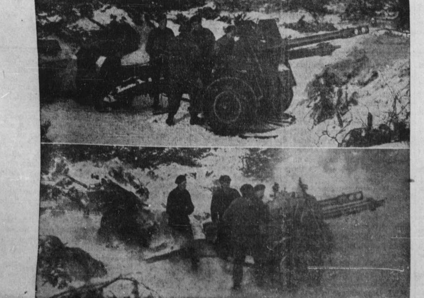
Tandis que les armées russes se rapprochent de Berlin par l'est, les troupes canadiennes avancent par la Hollande vers la capitale allemande. L'artillerie canadienne grande jour et nuit repoussant les Boches. Dans la tranquillité apparente de la photo supérieure, telle au fait pu être prise dans un camp d'entraînement en Angleterre ou au Canada, ces canonniers canadiens chargent méthodiquement leur canon de 25 livres... mais une seconde plus tard, tel qu'illustré dans la photo du bas... un projectile meurtrier est lancé vers les lignes allemandes tandis qu'un artilleur canadien est prêt à passer au chargeur un nouvel obus.