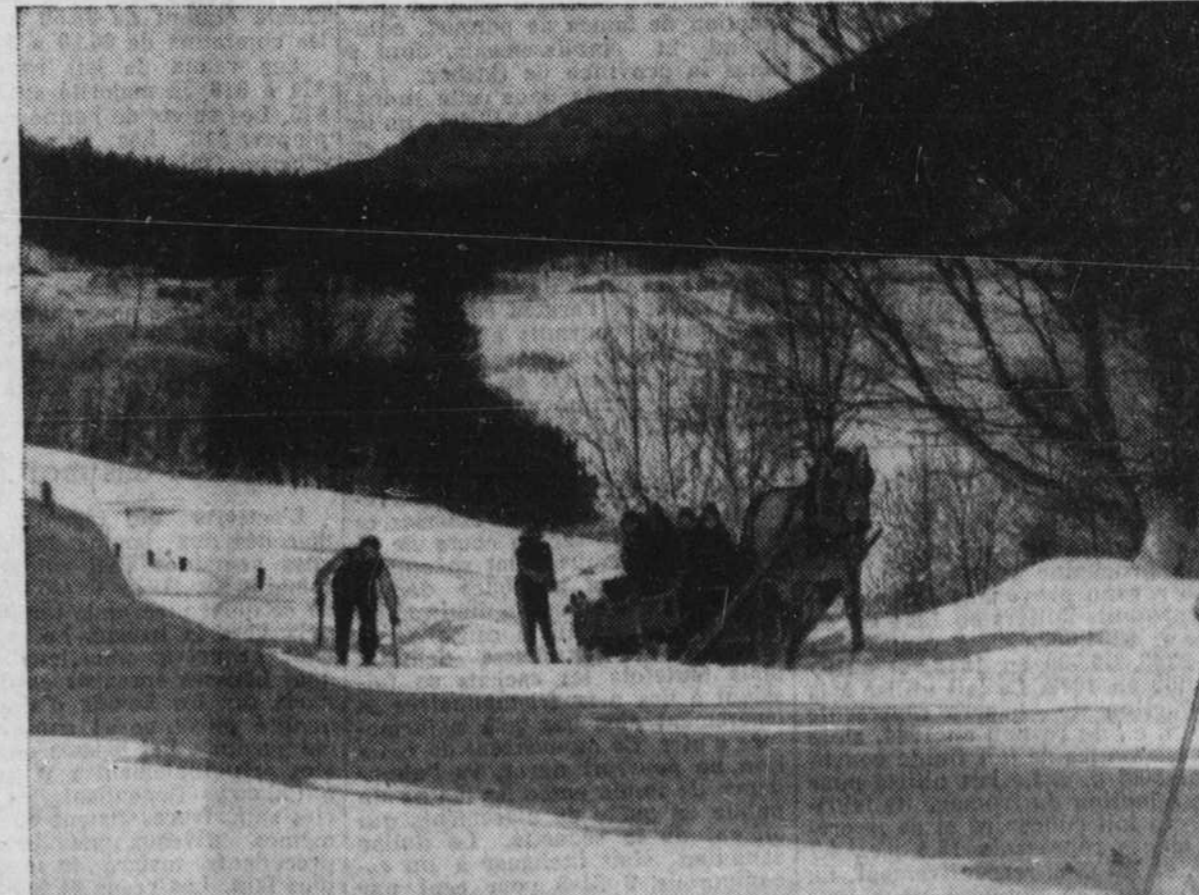
Le Ski dans les Laurentides est un des sports d'hiver typiques du Québec.