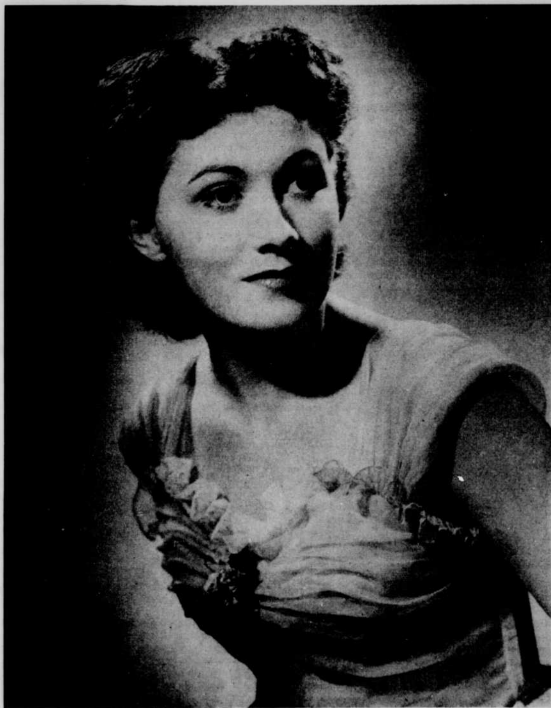
Vedette du théâtre, du cinéma, de la radio et de la télévision.