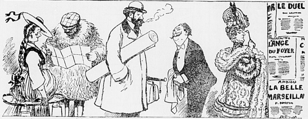
Dans les vallons de l'Helvétie.

En passant par l'arrière boutique de la revue un homme médiocre devenait un homme de génie, un mauvais avocat devenait un homme important, les hommes les plus purs