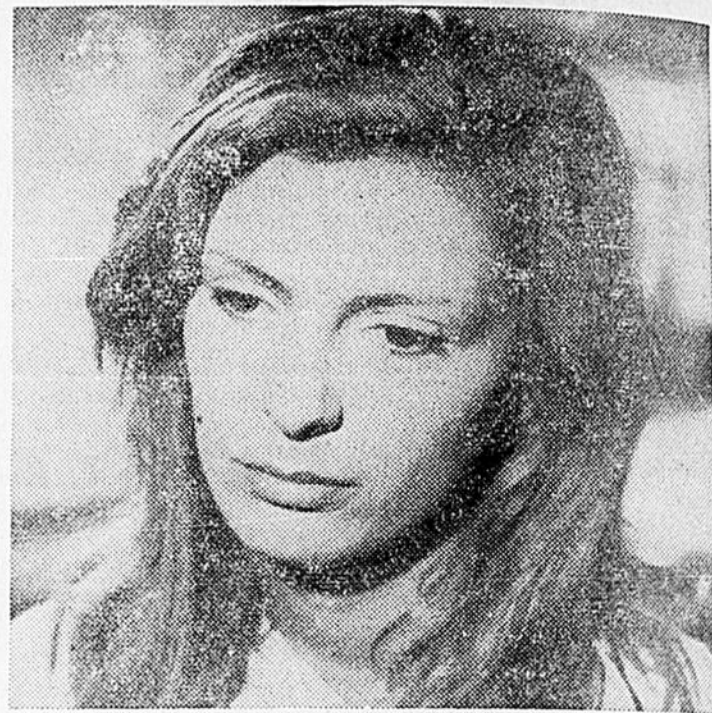
Andrée Debar, l'émouvante interprète du film "Les Mauvents" qui prendra l'affiche dès samedi, au Cinéma de Paris. En programme double : "Le Trésor des Pieds Nicklés", avec Rellys, Maurice Baquet et Jean Paredès.