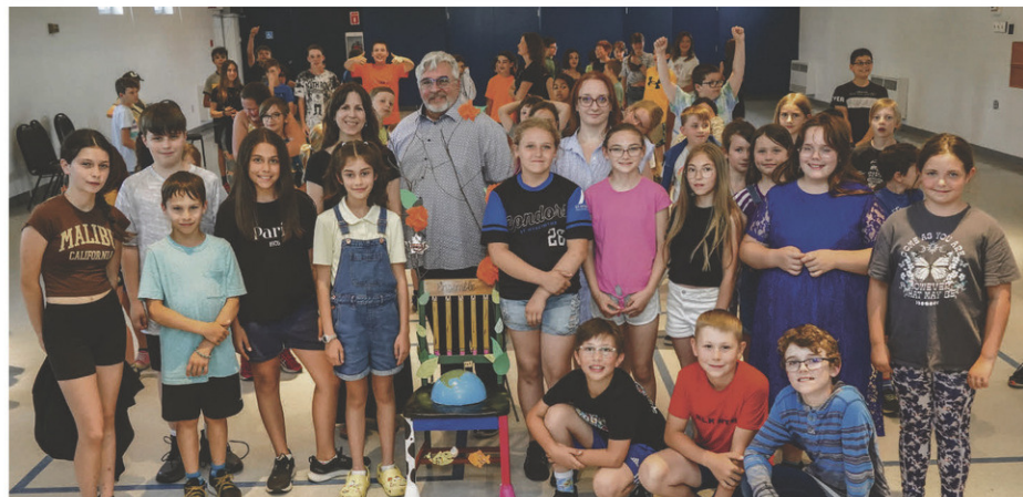
La Chaise des générations rappellera aux élus de Saint-Valérien-de-Milton de prendre des décisions en tenant compte des générations futures.

Sur le dossier de la chaise, on trouve l'inscription « Ensemble ». Les enfants ont choisi ce mot puisqu'un changement positif pour l'environnement n'est possible que si nous travaillons en collaboration. C'est la raison