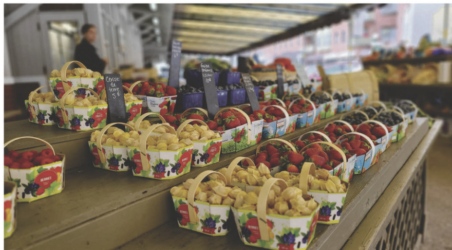
Le 1555 Marché public de Saint-Hyacinthe regorge de produits frais et locaux.

« L'Association des marchés publics du Québec (AMPQ) est le 2 e plus grand réseau de marchés publics au Canada avec plus de 150 marchés publics, ce qui place le Québec à titre de leader dans ce secteur. Durant la belle saison, de mai à octobre, les marchés publics saisonniers génèrent plus de 1,2 million de visites et des retombées de plus de