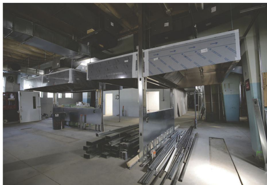
La future cuisine du Centre de bénévolat occupera le vaste espace du sous-sol de l'église Notre-Dame-du-Très-Saint-Sacrement.