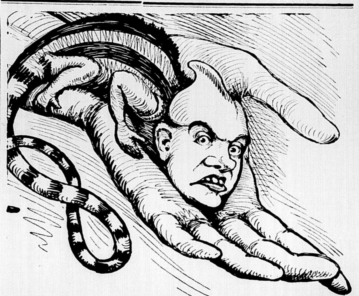
CAMILLIEN. — Il y en a qui appellent cette gentille petite bête un caméléon, parce que son corps change souvent de couleurs... politiques. Mais regardez bien sa tête. Est-ce qu'elle n'est pas toujours "houdiste"? C'est pourquoi je formerai peut-être un parti qui sera un caméléon "houdiste".

Ensuite les Rochefort et tutti quanti, dont les relations, du reste, n'ont jamais été très cordiales avec M. Duplessis, seraient jetés par-dessus bord même avant le jour de la nomination, ou sandwichés entre un candidat duplessiste et un candidat libéral, avec perspective certaine d'être battus.