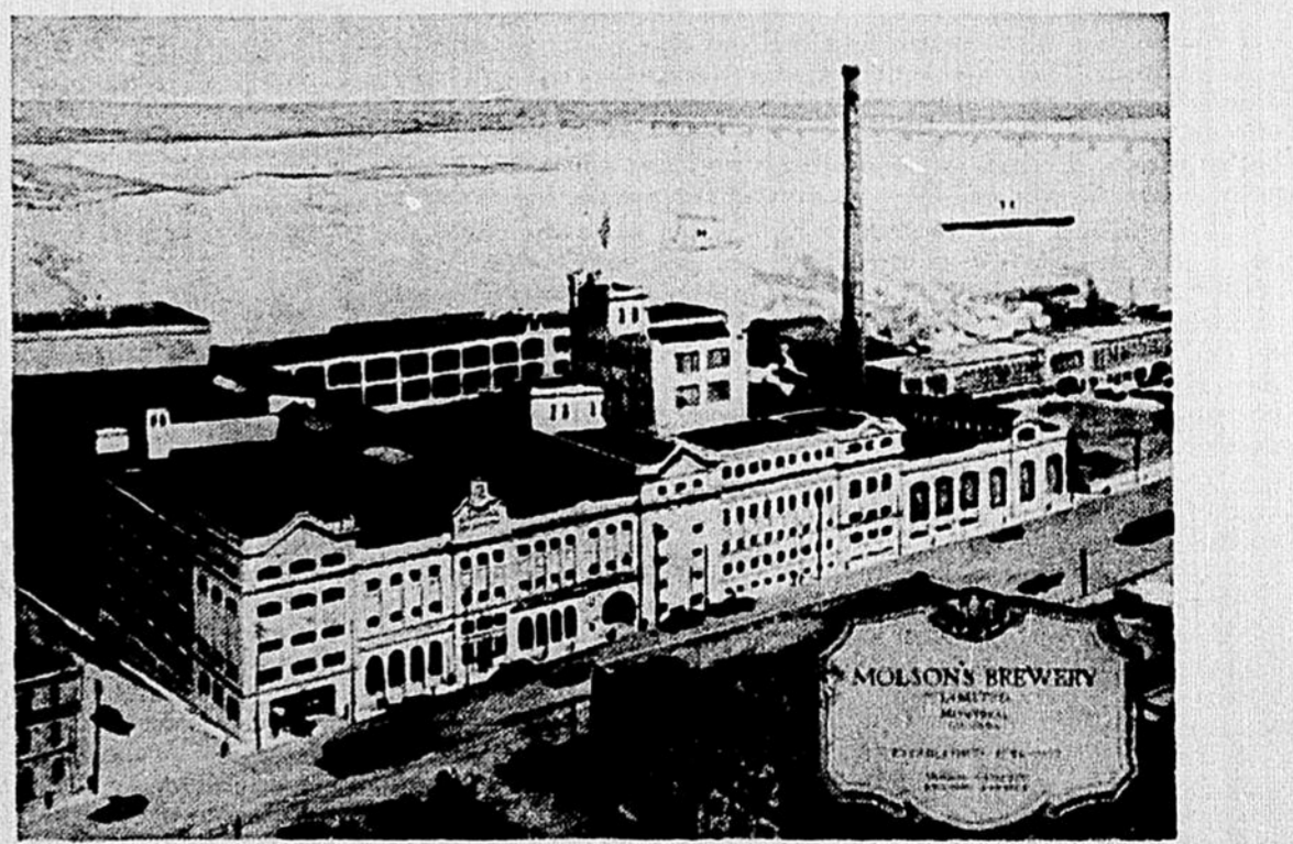
La Brasserie Molson à l'heure actuelle.