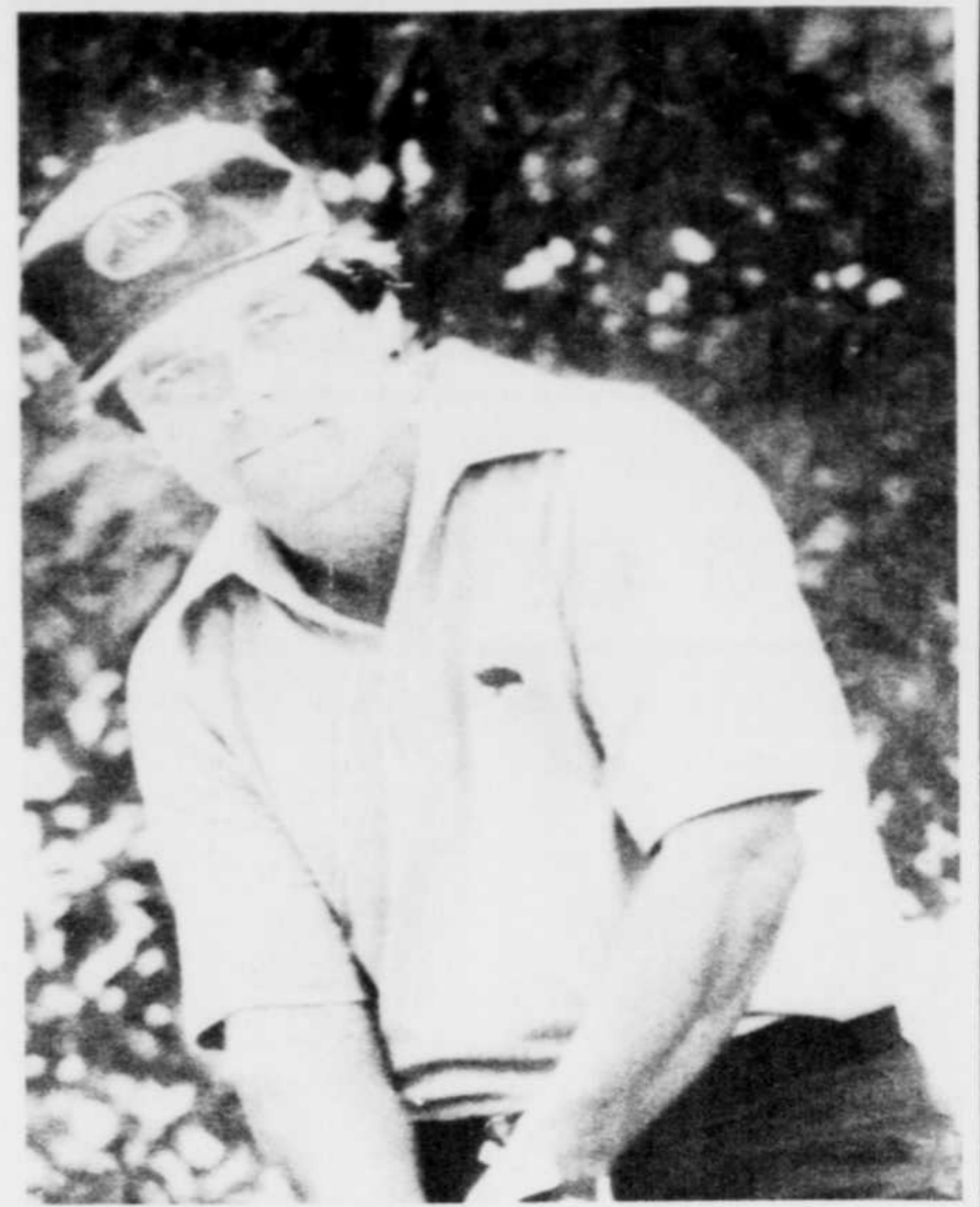
Lee Trevino ne se compte pas au nombre des favoris...

Ainsi, le groupe américain comptera environ 12 membres, y compris les candidats au titre Watson, Jack Nicklaus et Lee Trevino.