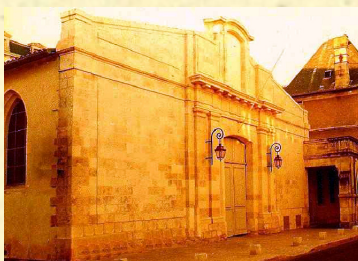
Chapelle Sainte-Marguerite