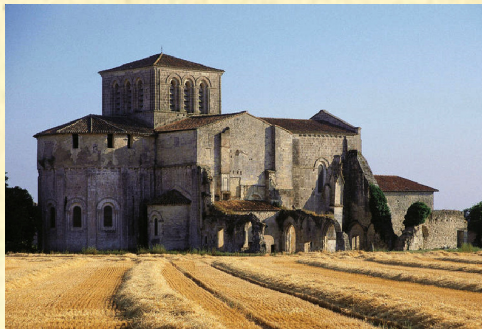
Prieuré Notre-Dame de Lanville