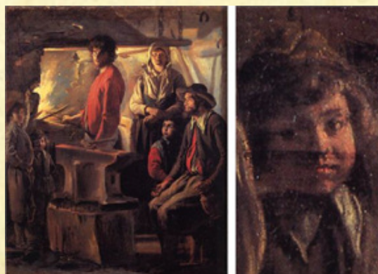
Louis Le Nain (1593-1648), La forge.