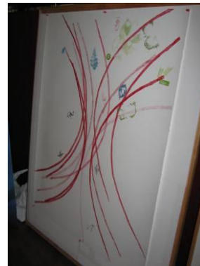
Œuvre en cours de réalisation