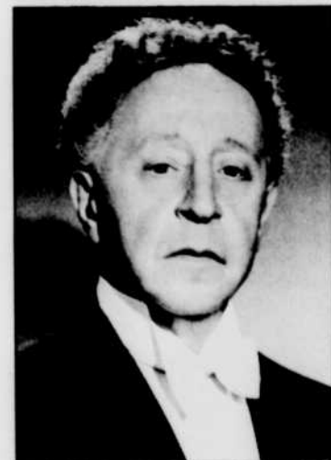
Artur RUBINSTEIN joue le Concerto en la mineur de Schumann avec l'Orchestre symphonique de Montréal, mardi à 20 h 30.