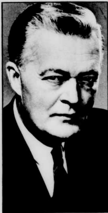
Hon. Jean LESAGE