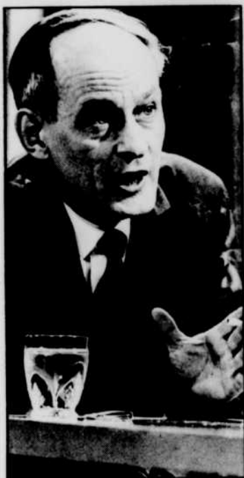
Hon. René LEVESQUE