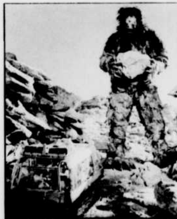
Une scène de «Perdus dans l'espace», à 19 h 00.