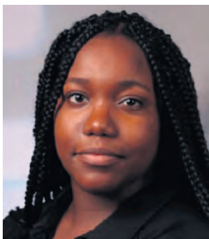
IMPLICATION DANS LA VIE SCOLAIRE