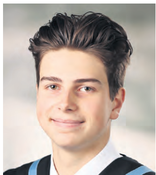
MÉDAILLE ACADÉMIQUE DU GOUVERNEUR GÉNÉRAL 2022-2023

Nous vous présentons ici quelques-uns des gagnants qui sont montés sur la scène du Théâtre Hector-Charland lors de cette soirée.