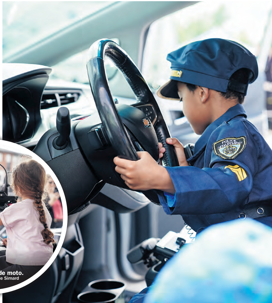
Un futur membre du SPVR.

Ce fut une belle reconnaissance pour les policiers de voir les gens se déplacer en si grand nombre et s'intéresser au métier policier. Ce qui a permis aux gens de mieux comprendre le métier, les outils, l'univers policier. Une belle journée de rapprochements et d'échanges importante pour l'équipe du SPVR.