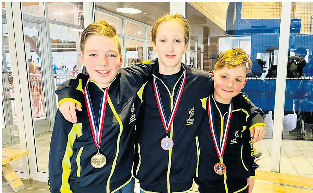
Une belle performance des jeunes

Le Club de plongeon Repentigny est établi depuis plus de 30 ans et a pour mission principale de desservir la région en offrant des cours de niveau débutant à compétitif. Le Club se distingue par la passion contagieuse des entraîneurs et par leur capacité à faire évoluer les athlètes, tout niveau confondu. Il compte aujourd'hui plus de 120 plongeurs dont plusieurs athlètes se sont démarqués par leur performance de haut niveau, au fil des années.