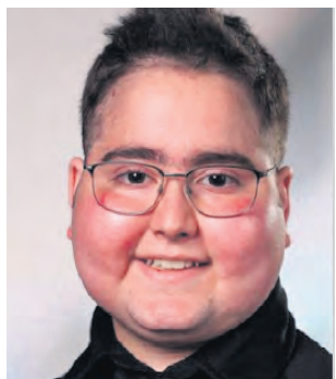
PRIX DE L'ACÉDA