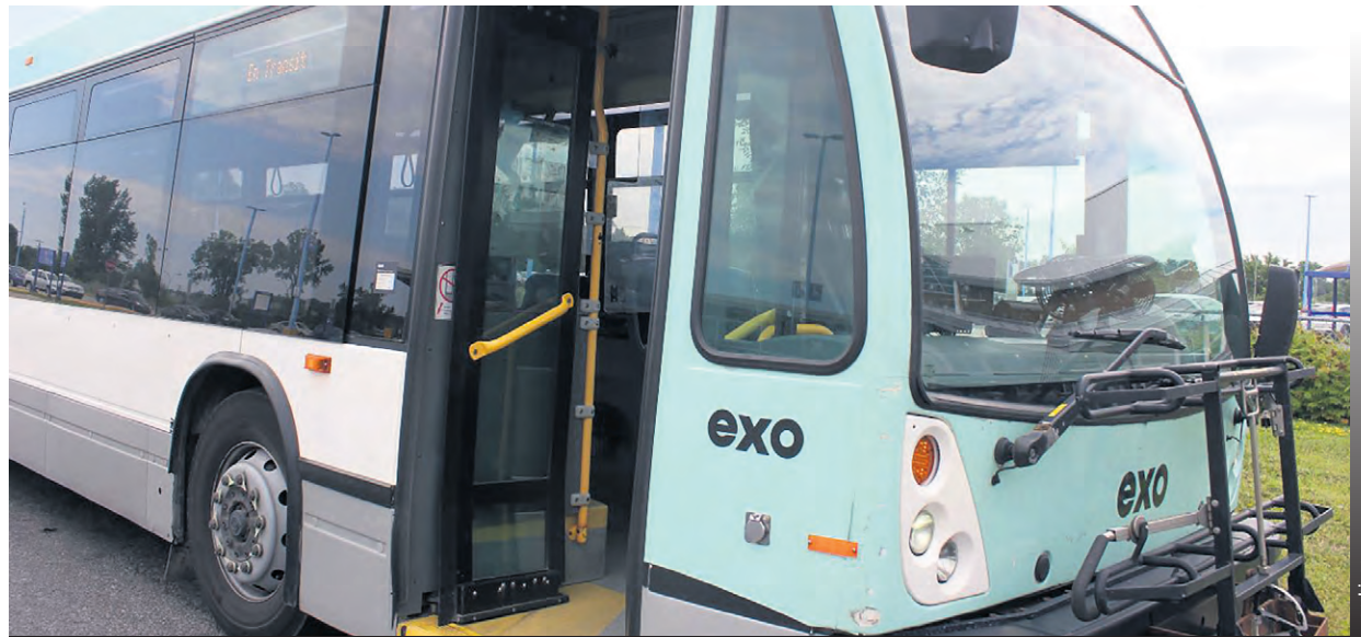
L'horaire d'été des autobus d'exo sera en vigueur du 24 juin au 18 août.

Par ailleurs, il est à noter que les horaires de train demeurent inchangés durant l'été. Il en va de même pour le service de transport adapté qui poursuivra ses activités comme à l'habitude, en assurant les déplacements demandés. (MCG)