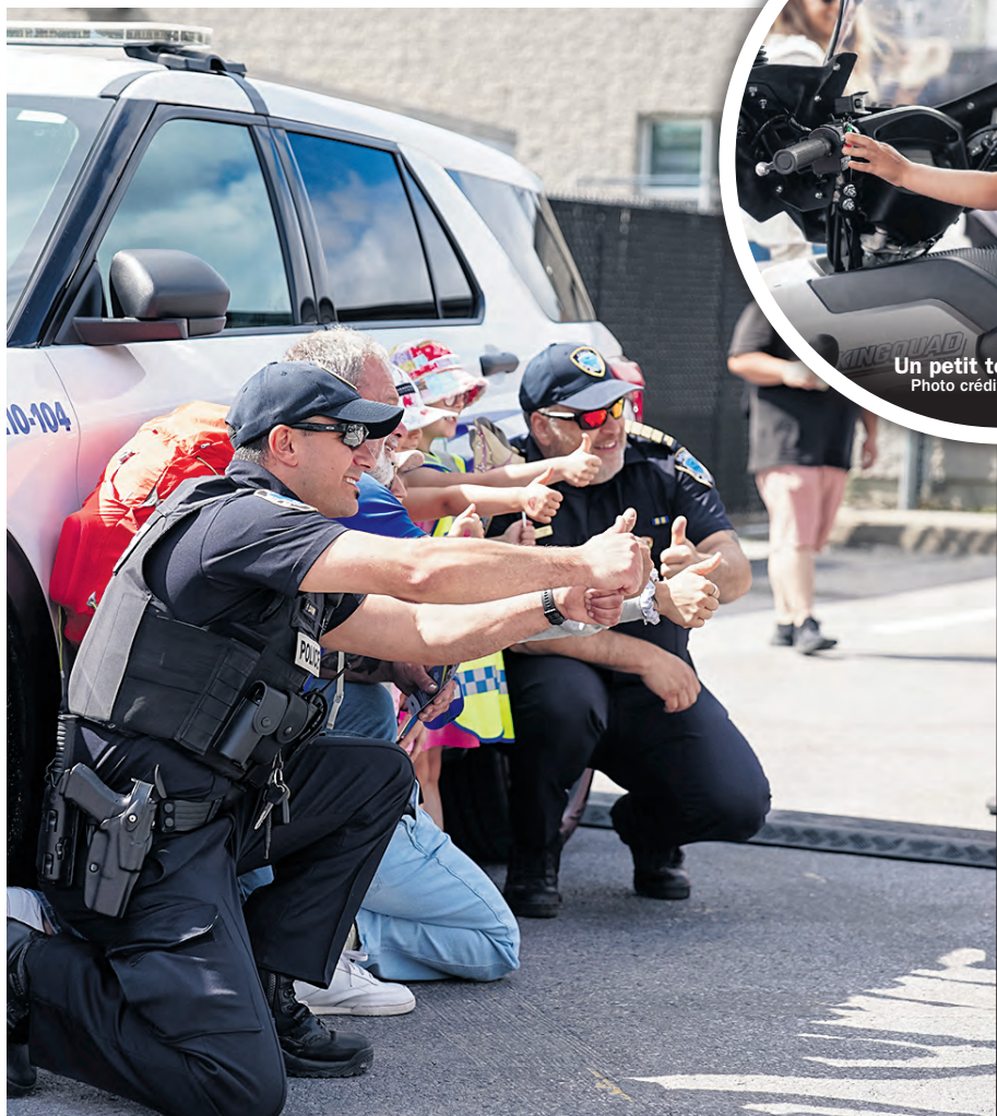
Une belle journée pour les jeunes.