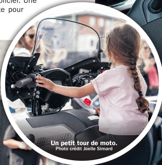
Un petit tour de moto.