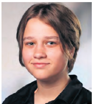
MÉDAILLE DU LIEUTENANT GOUVERNEUR POUR LA JEUNESSE