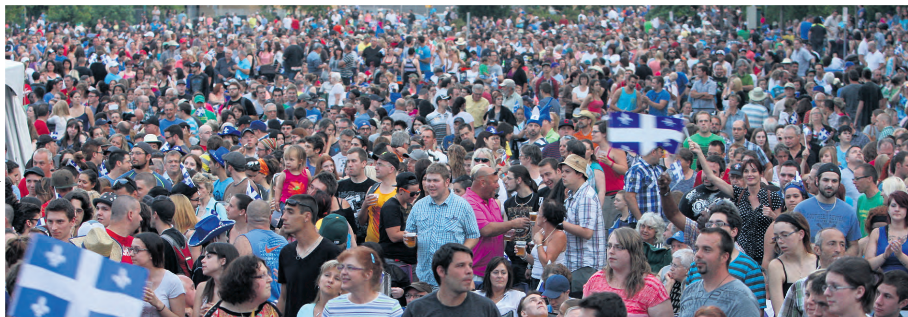
Des fêtes sont organisées aux quatre coins de la région.