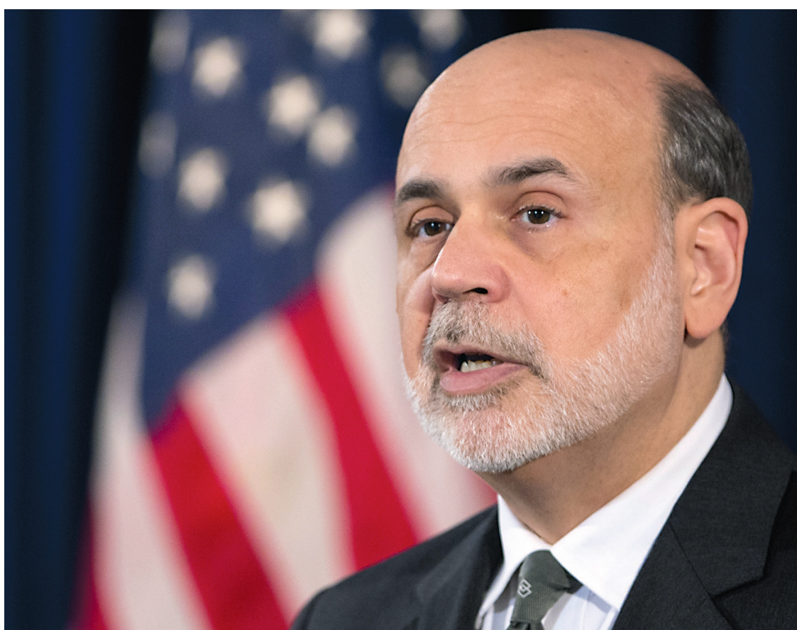
Ben Bernanke: « Notre objectif est de rendre notre politique la plus transparente et la plus claire possible afin que les gens puissent s'ajuster à l'évolution de l'économie [...] »

« Notre objectif est de rendre notre politique la plus transparente et la plus claire possible afin que les gens puissent s'ajuster à l'évolution de l'économie sans devoir attendre notre prochain communiqué », a expliqué celui dont l'institution — contrairement à la plupart des banques centrales, dont celle du Canada — a le double mandat de maintenir la stabilité des prix ET la création d'emplois. Il a précisé que l'atteinte d'une seule condition ne sera pas nécessairement suffisante pour déclencher une hausse des taux directeurs et qu'on ne se fiera pas seu-