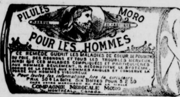
L'Étiquette est de papier blanc imprimé en bleu.

Fac-Simile exact d'une boîte de Pilules Moro.